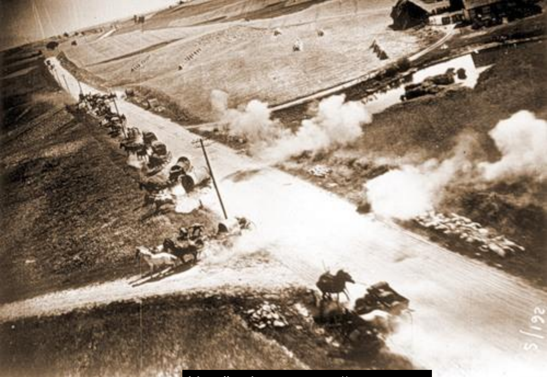
Налёт фашистской авиации