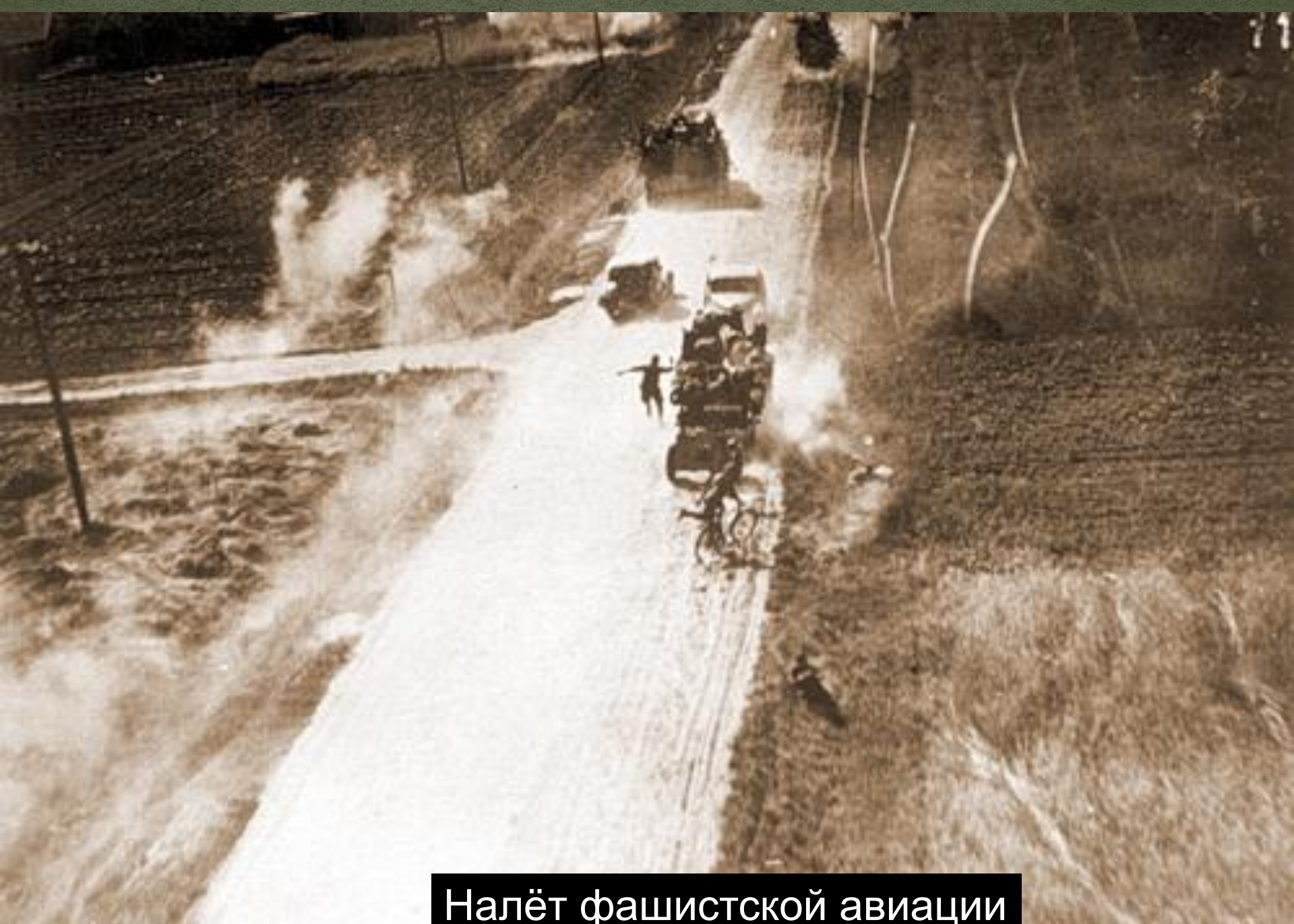
Налёт фашистской авиации