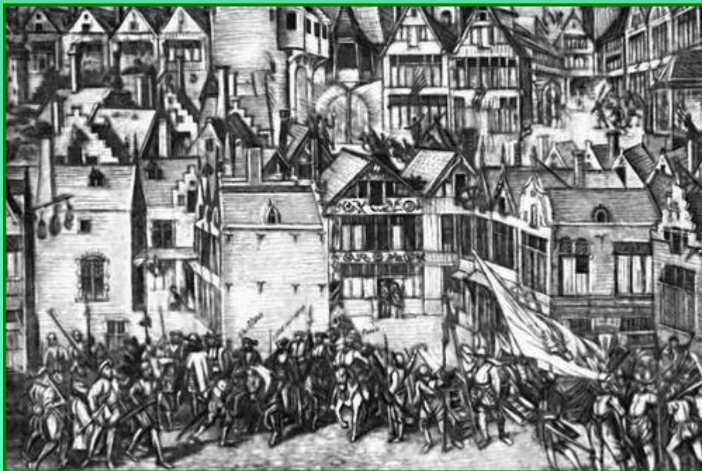
Иконоборческое восстание в Антверпене 1566 г.

Сначала в мятеже участвовали все: горожане, часть крестьян, наемные рабочие, торговцы и дворяне. Позже дворяне, испуганные требованиями восставших о разделе имущества, стали отходить от движения.