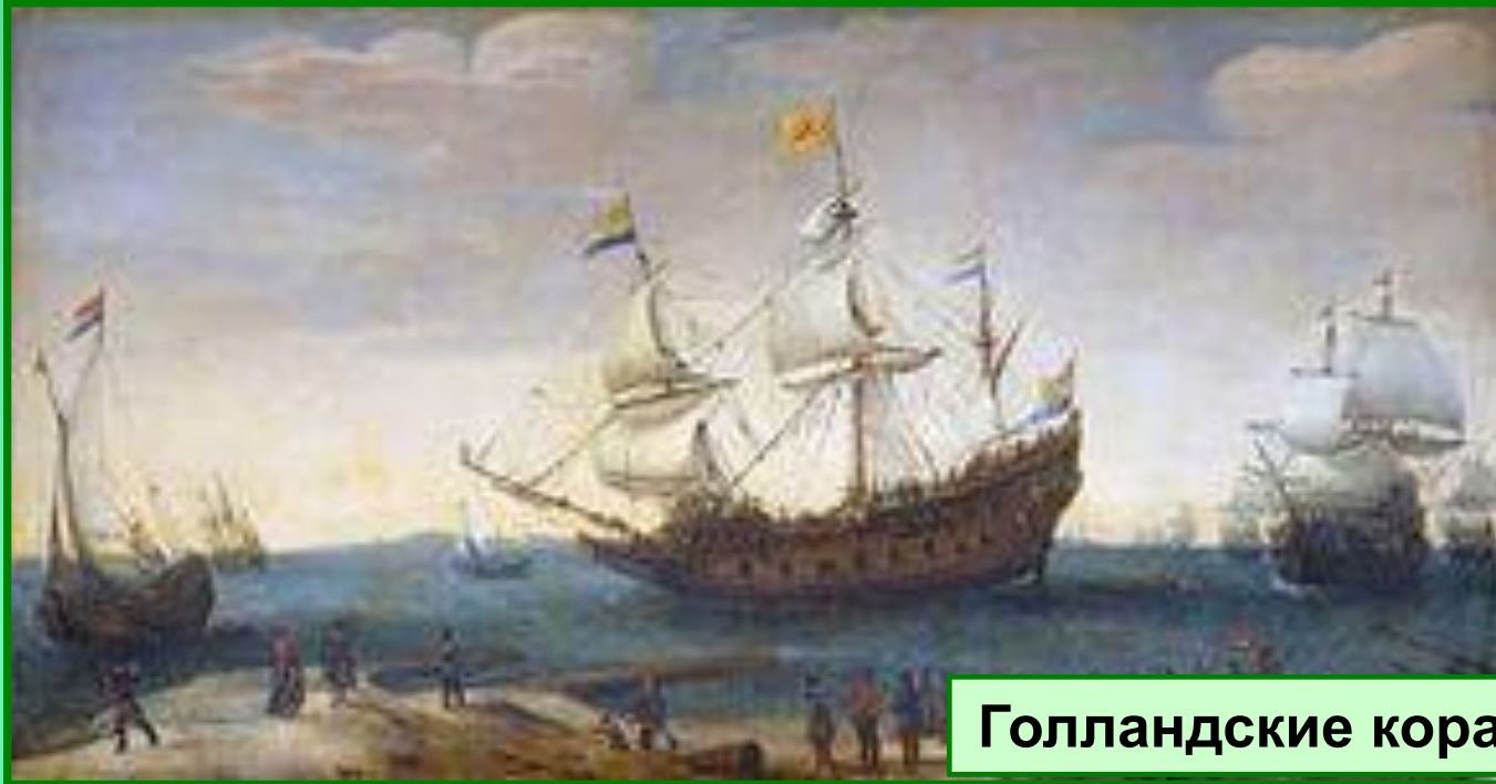
Голландские корабли 17 в.

Победа в национально-освободительной войне сделала Голландию самым развитым государством Европы, наступил расцвет промышленности.