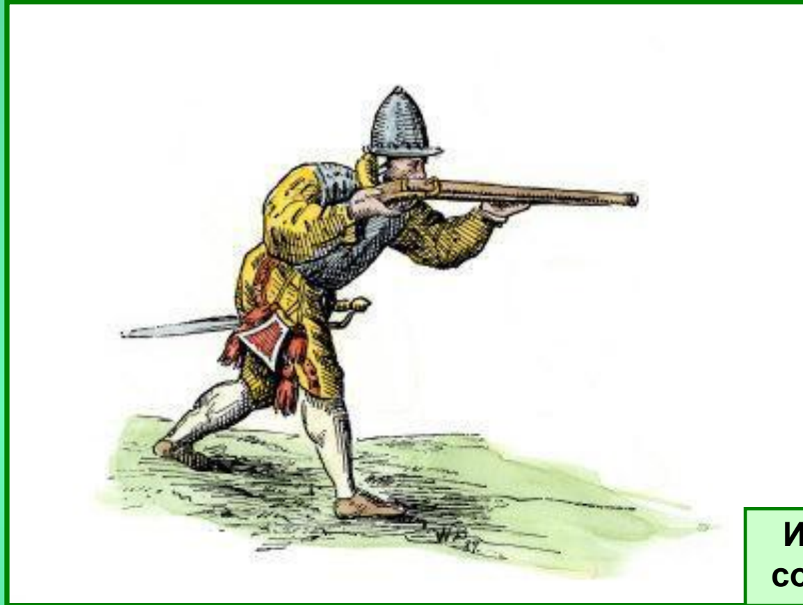
Испанский солдат 16 в.

Испанцы начали наступление против восставших провинций, жестоко карая непокорных. Филипп II был недоволен действиями Альбы в 1573 г. он был отозван. Испанские солдаты не получавшие жалованья жестоко грабили местное население.