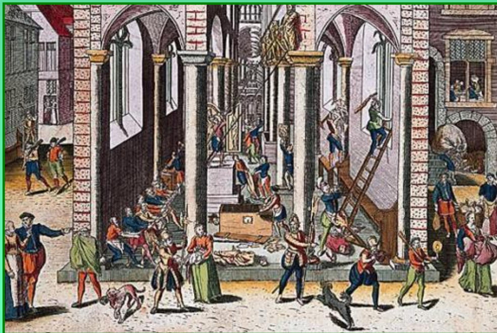
Разгром католической церкви кальвинистами

В 1566 г. по призыву проповедников на севере страны протестанты стали захватывать католические храмы, уничтожать иконы, скульптуры святых, предметы культа. За несколько месяцев иконоборцы разгромили 5,5 тысяч церквей и монастырей. Мятежники создавали вооруженные отряды, освобождали из тюрем кальвинистов, изгоняли католических священников и испанских чиновников, запретили инквизицию.