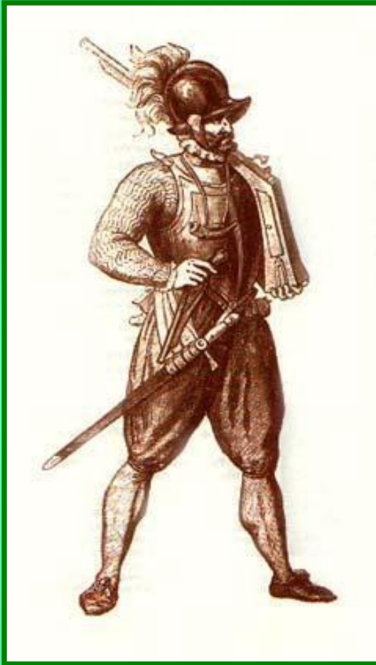
Испанский солдат 16 в.

Политика Испании приносила вред всем слоям населения Нидерландов. Недовольство политикой Габсбургов вызывало восстания городской бедноты и усиления влияния протестантизма.