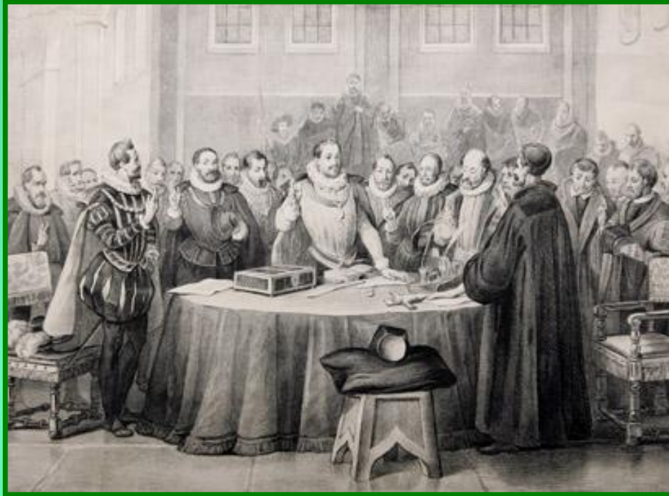
Заключение Утрехтской унии

В 1579 г. семь провинций Северных Нидерландов заключили в Утрехте унию – военно-политический союз против Испании. В 1581 г. Генеральные штаты объявили о низложении Филиппа II, избрав штатгальтером Вильгельма Оранского. Через несколько лет было провозглашено создание Республики Северных провинций (Голландия).