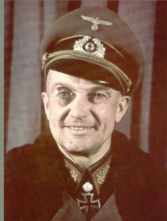
Отто - Мориц Вальтер Модель. Немецкий военачальник.

(Командующий группой армий «Центр» до 28 июня)