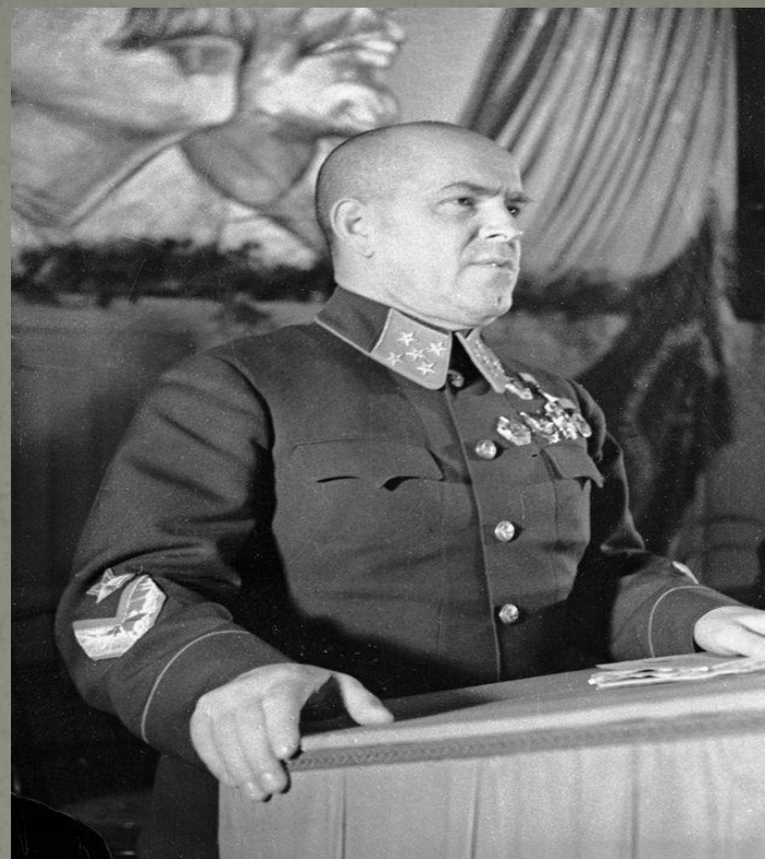
Г. К. Жуков

Советский военачальник. Маршал Советского Союза. Дважды Герой Советского Союза.(1-й белорусский фронт)