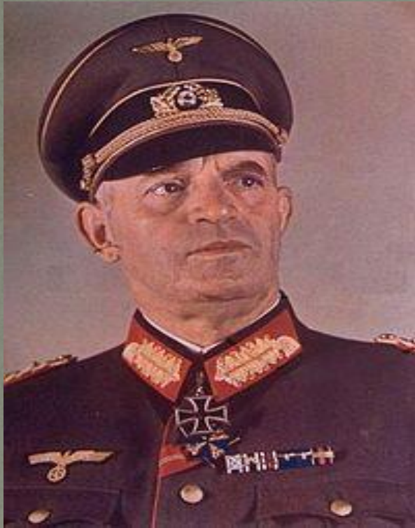
Эрнест Буш. Немецкий военачальник.

(Командующий группой армий «Центр» до 28 июня)