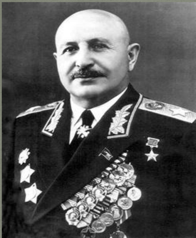
И.Х. Баграмян Советский военачальник, дважды Герой Советского Союза. Маршал Советского Союза, член ЦК КПСС. (1-й Прибалтийский фронт)