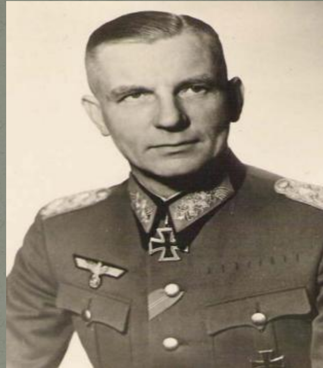
Курт фон Типпельскирх. Генерал пехоты вермахта.(4-я полевая армия)