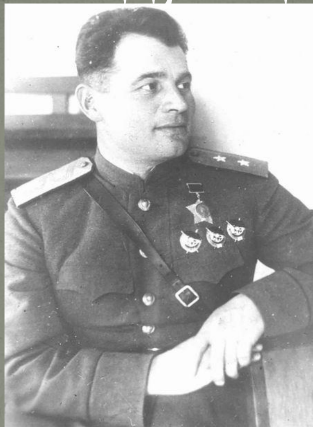
И.Д. Черняховский Советский военачальник, генерал армии. Дважды Герой Советского Союза. (3-й белорусский фронт)