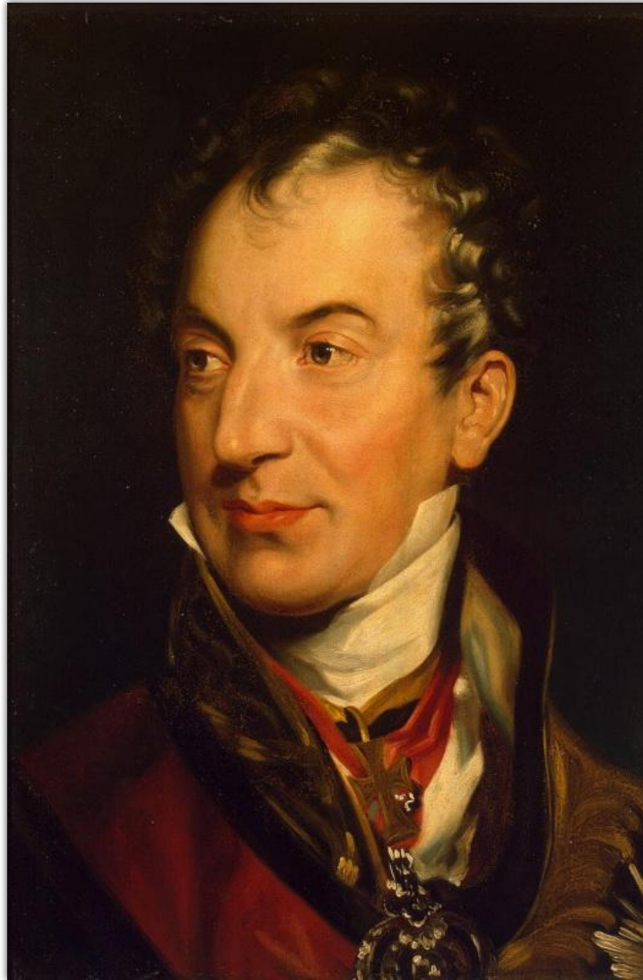
Клемент Меттерних (1773 – 1859 гг.)