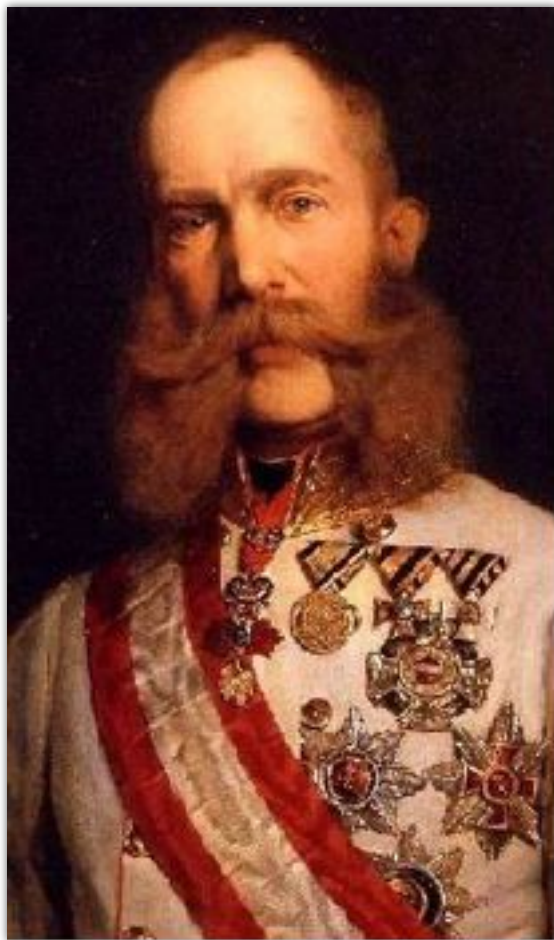
Франц Иосиф I (1830 -1916 гг.)