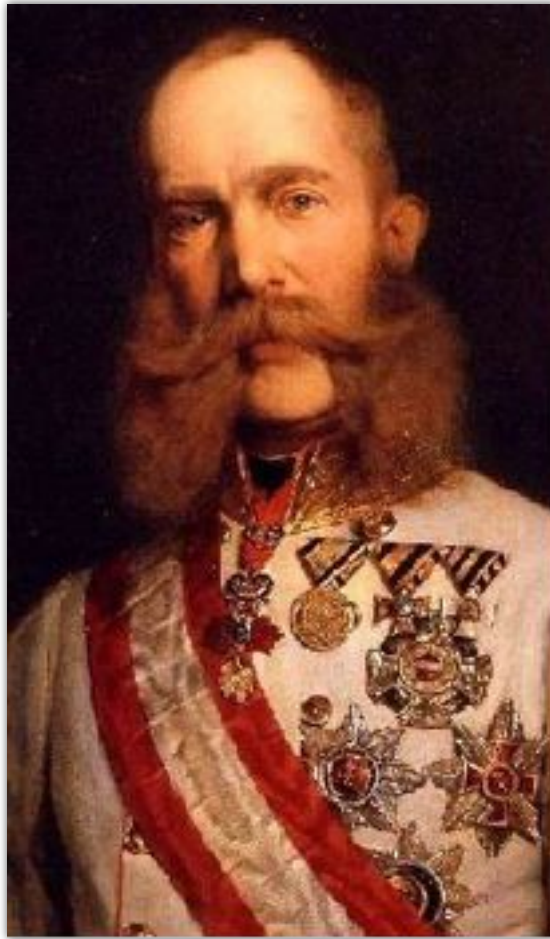
Франц Иосиф I (1830 -1916 гг.)