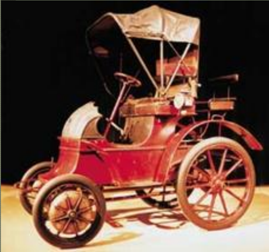
Первый автомобиль Ф.Порше