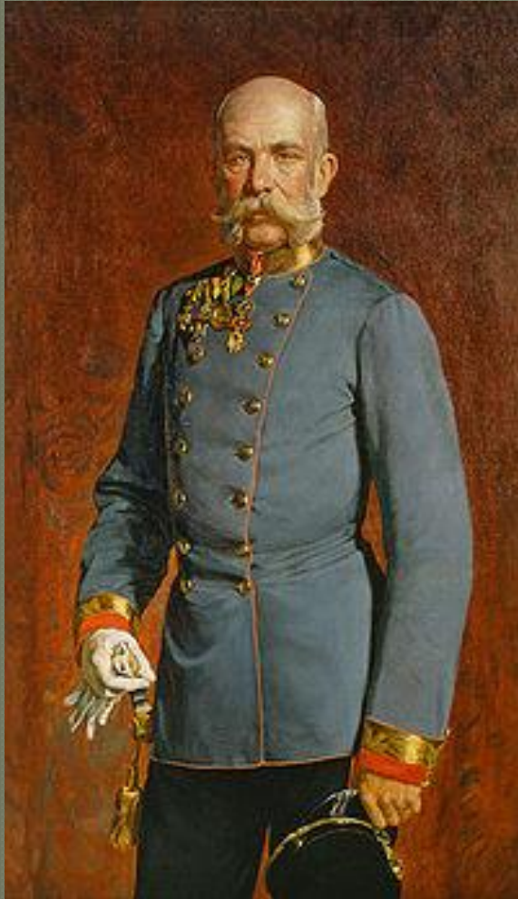
Император Франц Иосиф I (1867-1916гг.)

Империя переживала острый политический кризис.