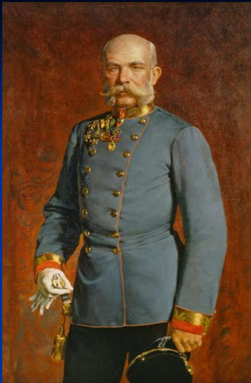
Император Франц Иосиф