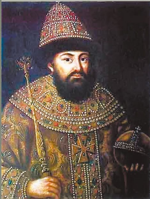
Великий князь московский и всея Руси Иван III Васильевич.

1480 год – освобождение русских земель от ордынской зависимости. Возникновение Московского государства.