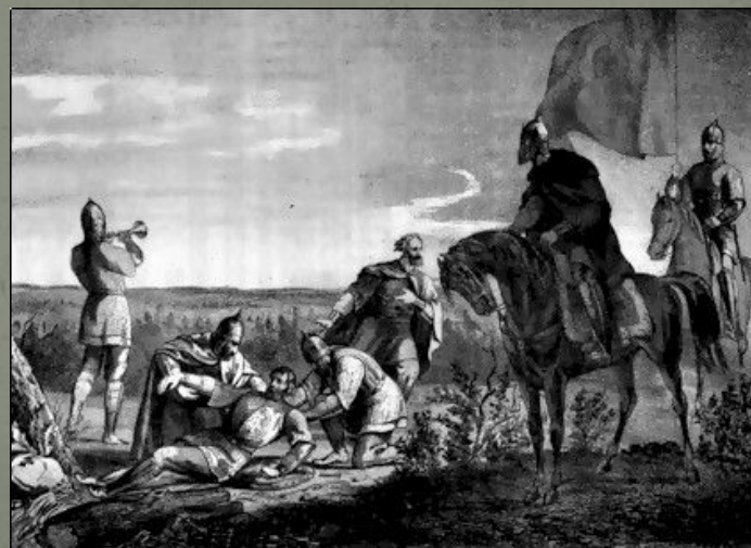
Раненый Дмитрий Донской.