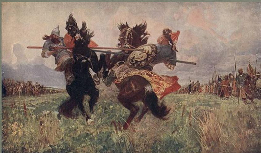
Поединок на Куликовом поле. худ. М.Авилов