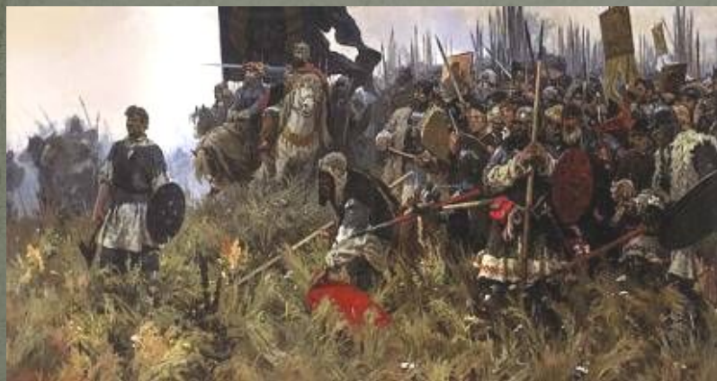
Утро на Куликовом поле. худ. А.Бубнов