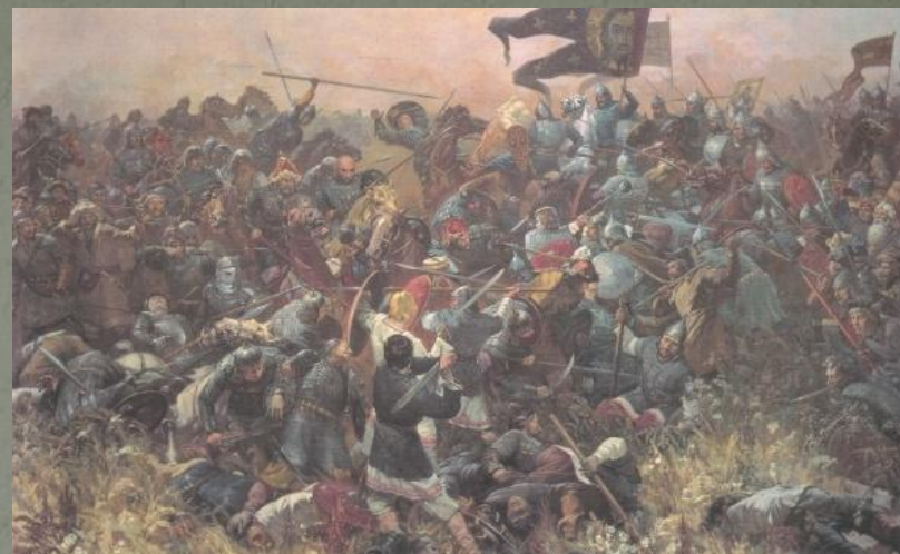
Куликовская битва. худ.Н.Присекин