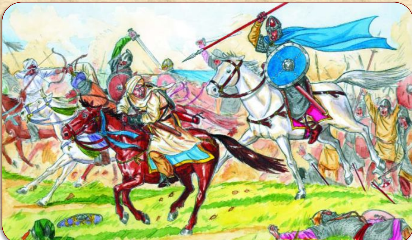
Битва франков и арабов при Пуатье в 732 году

Необходимый уровень. Перечисли причины, которые, на твой взгляд, позволили возвыситься Франкскому королевству.