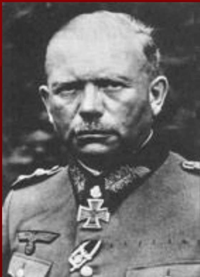
Гейнц Вильгельм Гудериан – командующий 2ой танковой группы