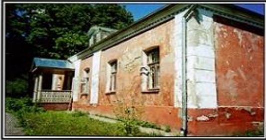
Боблово Август 2002 года