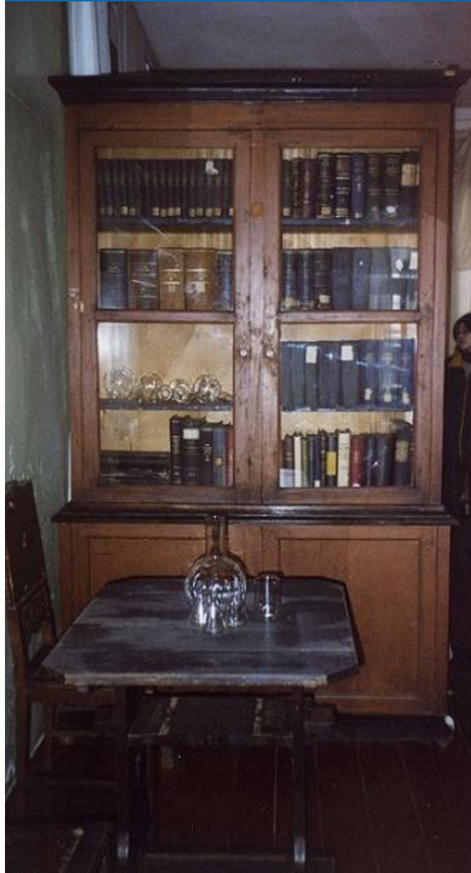
Боблово Октябрь 2002 года