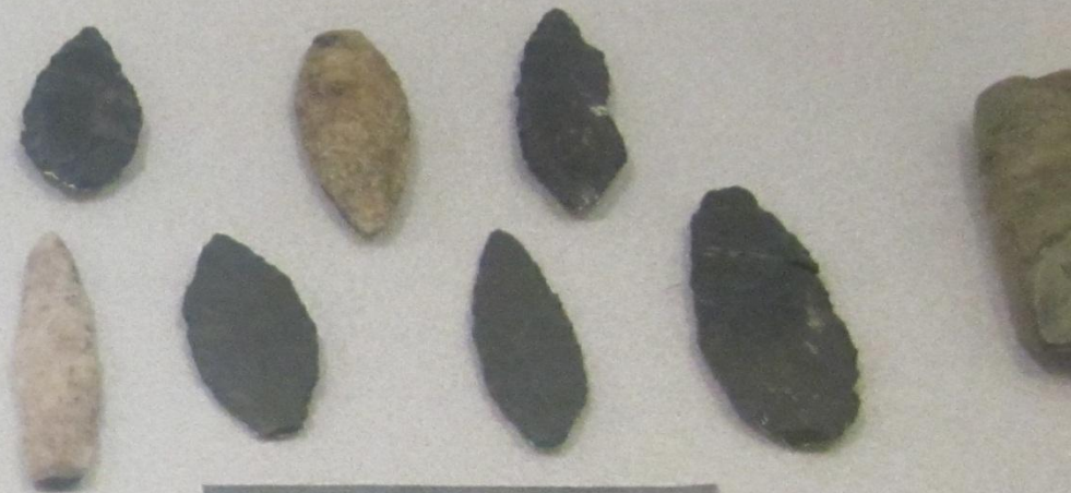
Һенгѣ баштары Наконечники копий