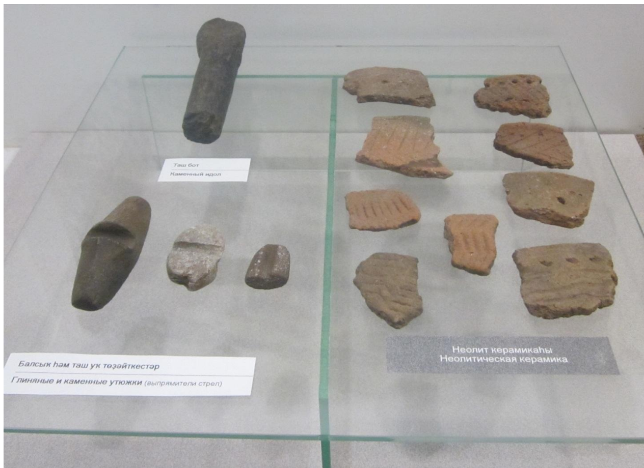
Глиняные и каменные утюжки