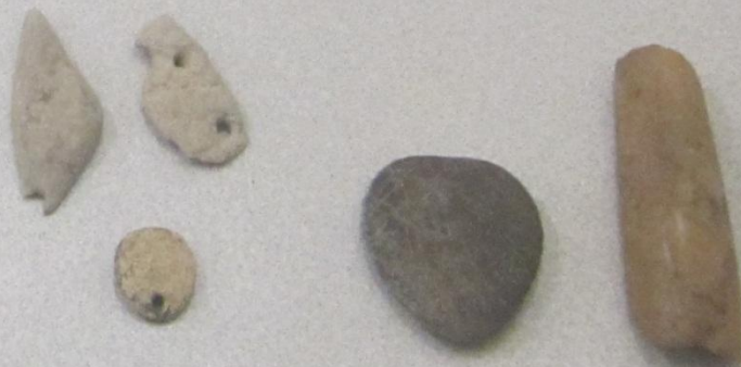
Энеолит дәүре бизәүестәре (таш сулпылар) Украшения эпохи энеолита – подвески из камня