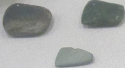
Шымартыусы балта һәм аркыры балталар Шлифовальные топоры и тѣсла