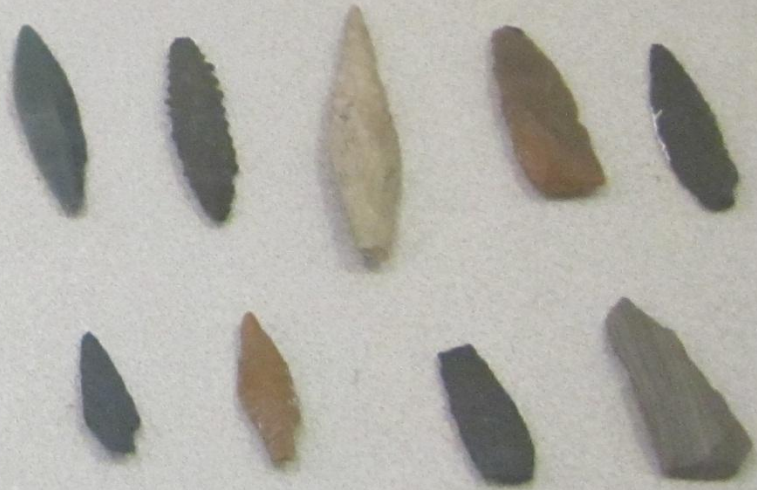
Сакматаш һәм йәшмәнән яһалған уҡ башақтары Наконечники стрел из кремня и яшмы