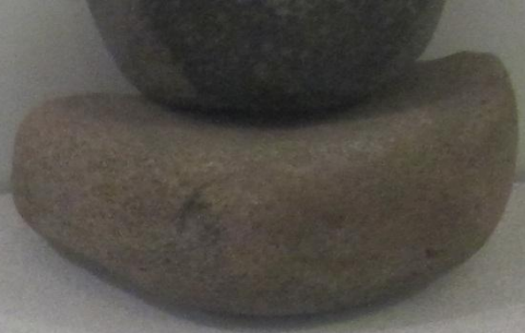
Ҙырыс һәм ҡырғу плаһаһы Тёрник и тёрочная плита