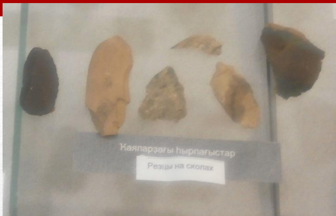
Резцы на сколах