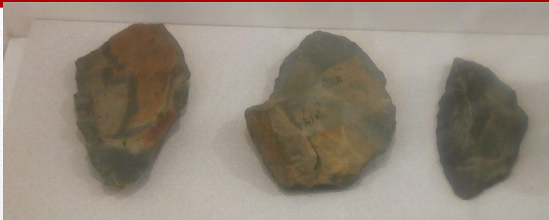
Остроконечники из яшмы