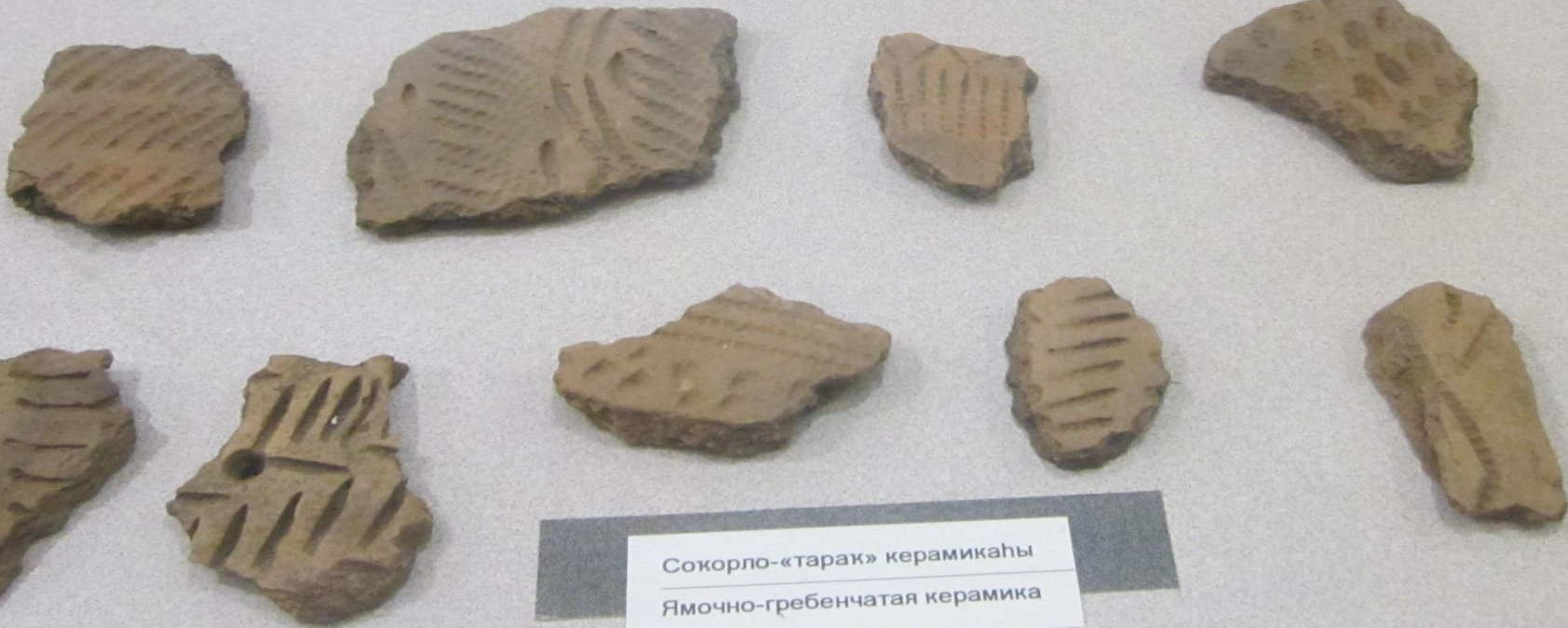
Сокорло-«тарак» керамикаһы Ямочно-гребенчатая керамика