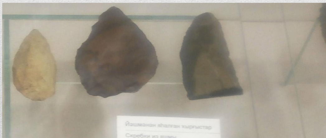
Скрёпки из яшмы