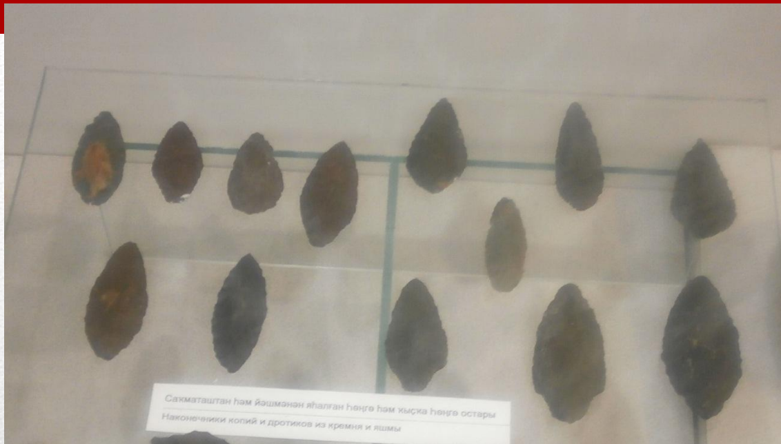
Наконечники копий и дротика из кремня и яшмы