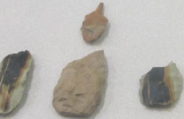
Энеолит дәүере корамалдары (бырау һәм балталар) Орудия эпохи энеолита (сверло и топоры)