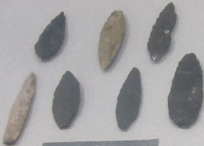
Һеңгә баштары Наконечники копий