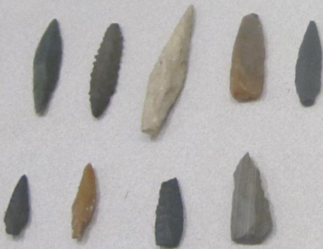
Сакматаш һәм йәшмәнән яһалған ук башақтары Наконечники стрел из кремня и яшмы