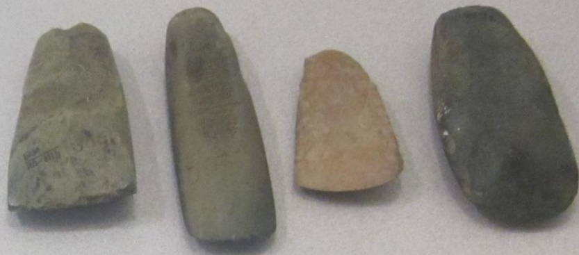
Шымартылған балталар Шлифованные топоры