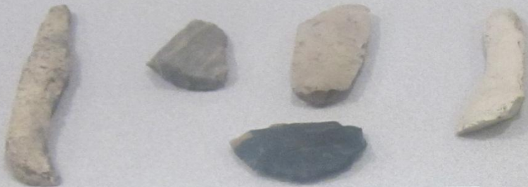
Неолит һәм энеолит дәүерҙәренең кесеү коралдары Режущие орудия эпохи неолита и энеолита