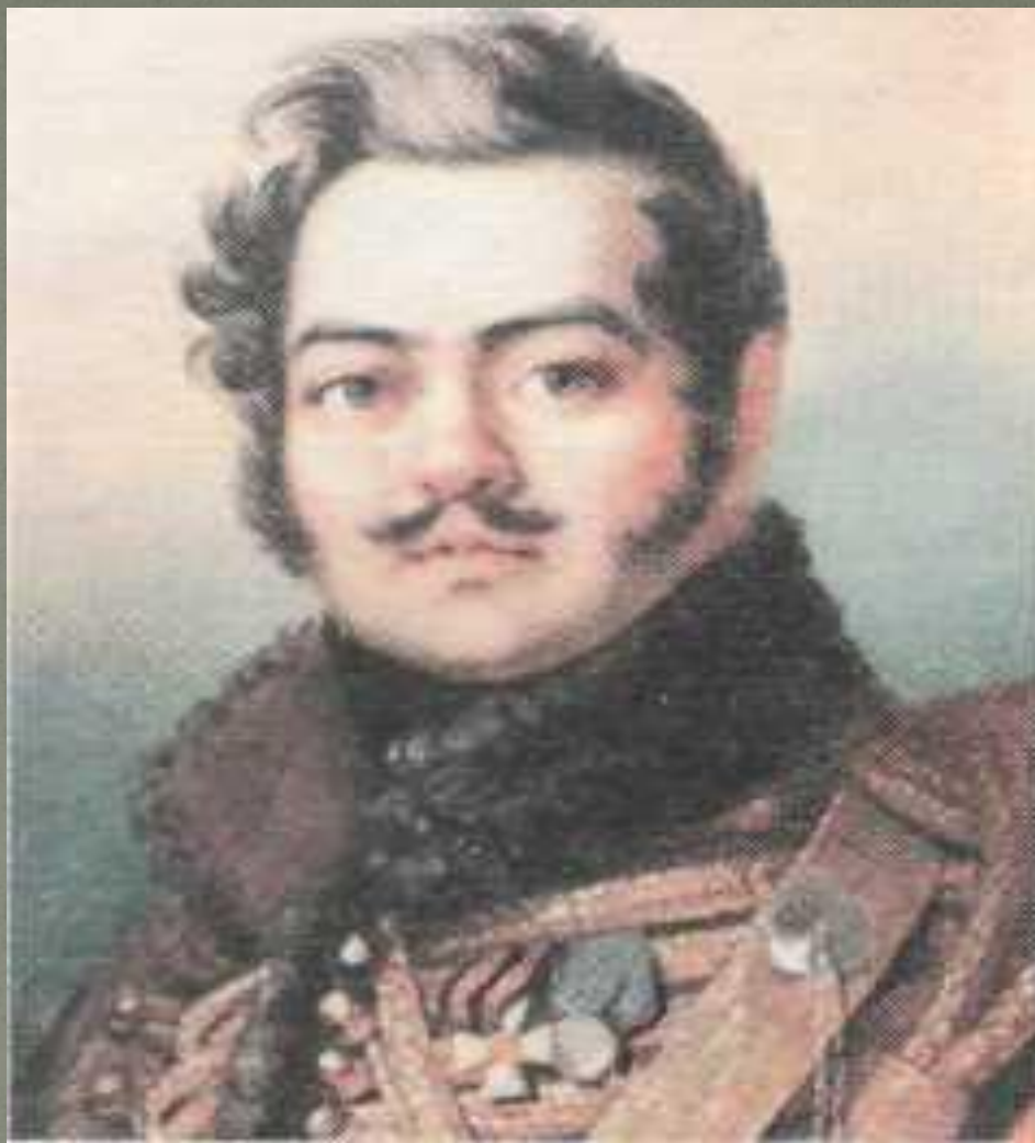
Д.В. Давыдов (1784 – 1839)