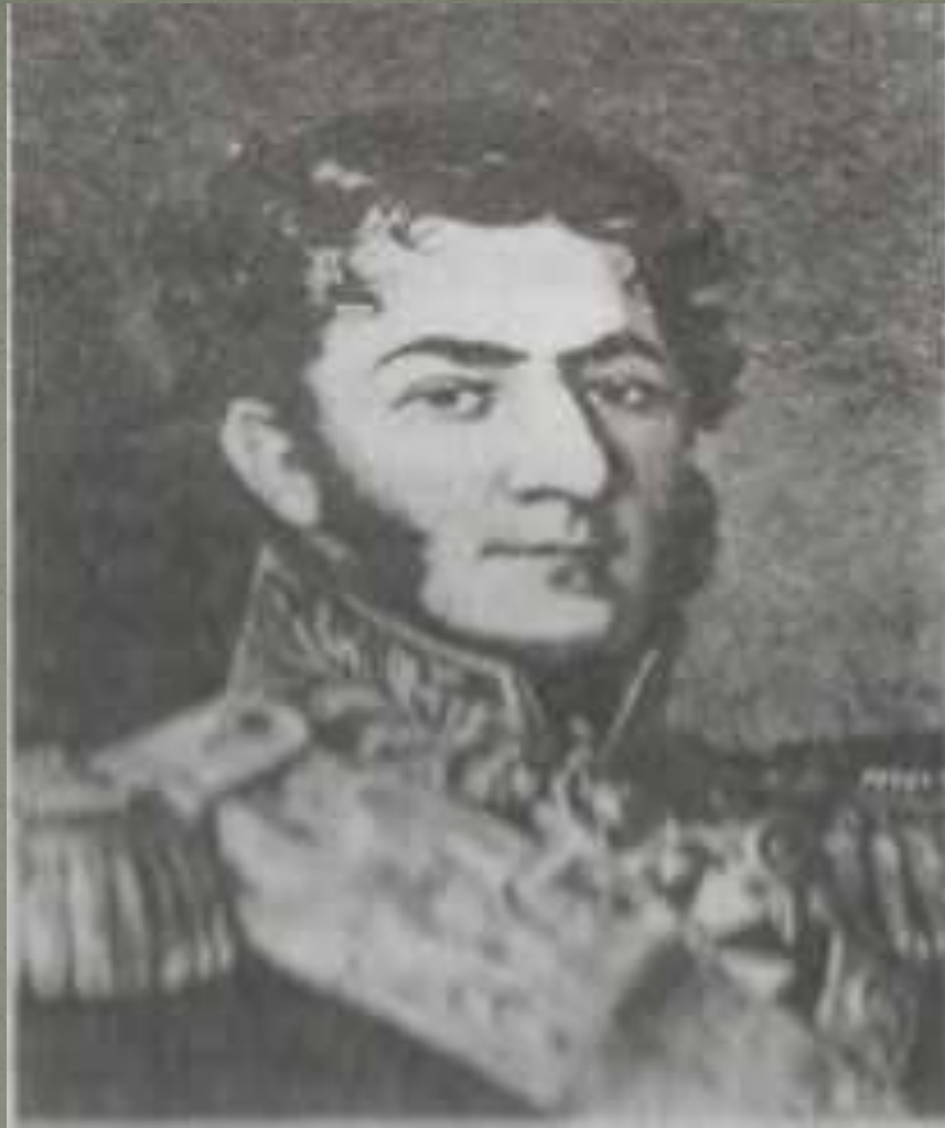
П.И. Багратион (1765-1812)