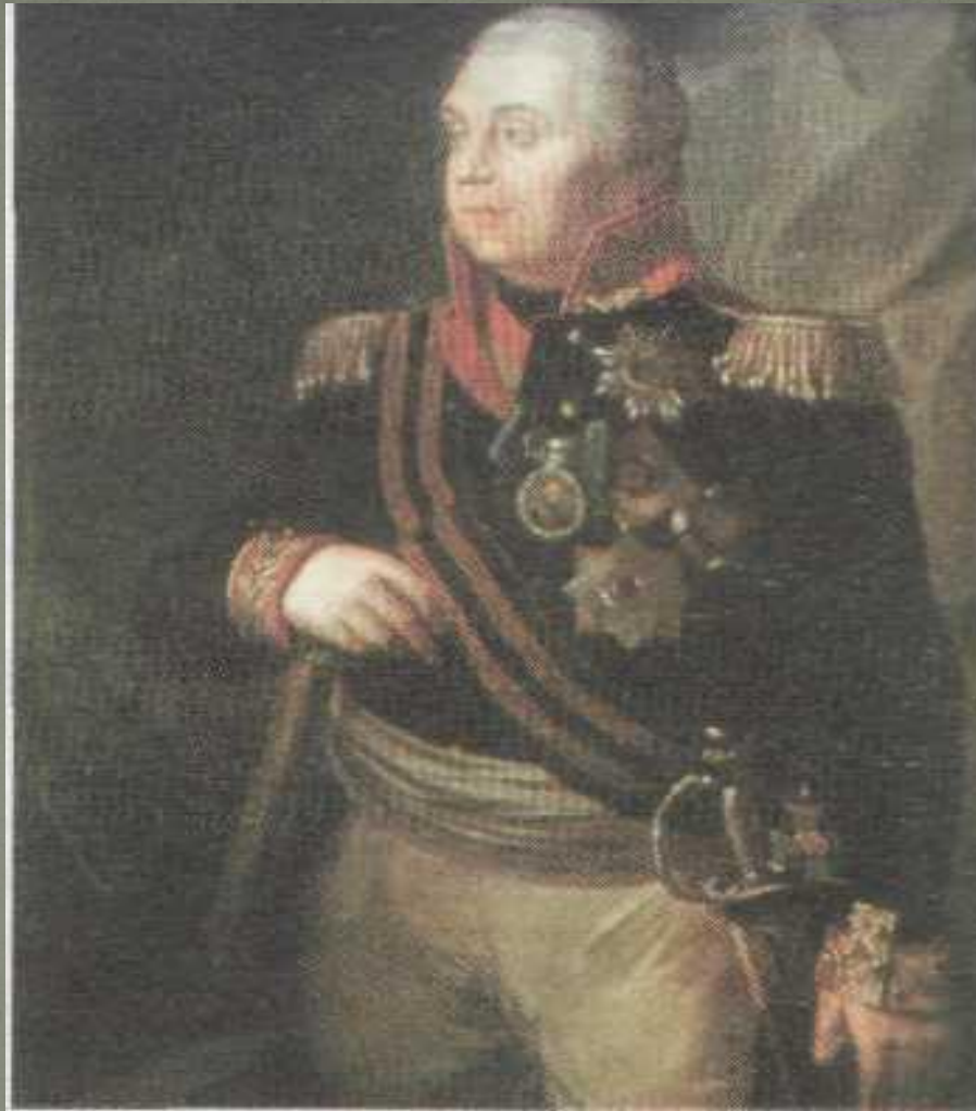
М.И. Кутузов (1745-1813)