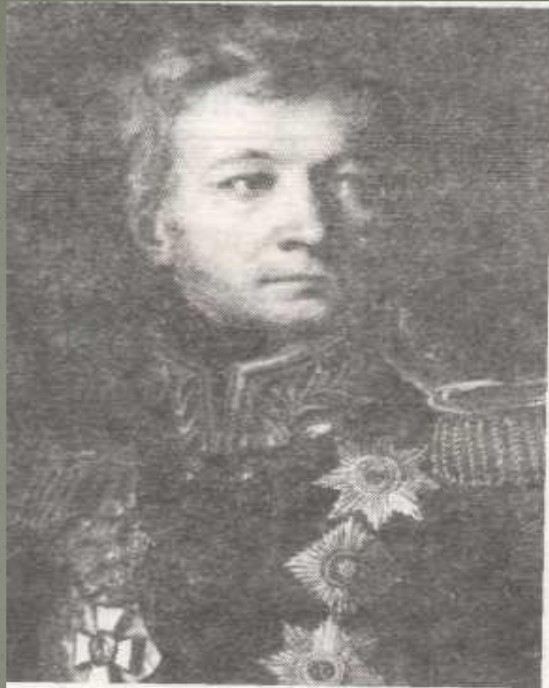
А.П. Тормасов (1752-1819)