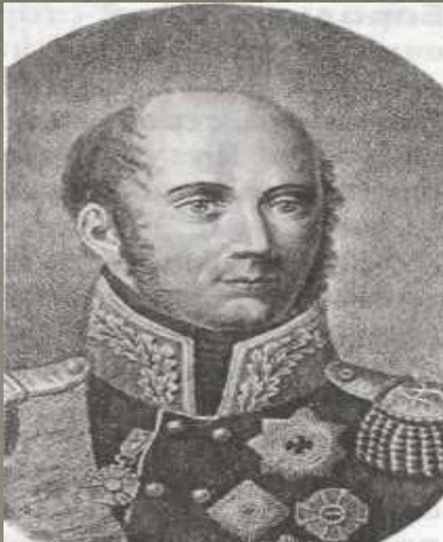
М.Б. Барклай де Толли (1761-1818)