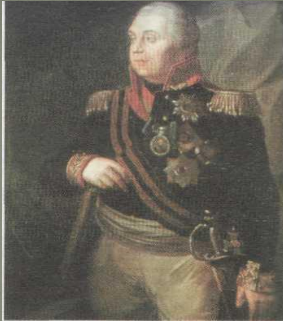
М.И. Кутузов (1745-1813)