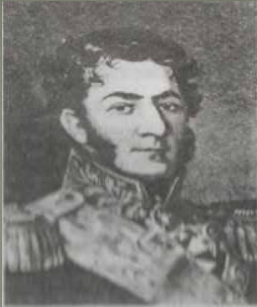
П.И. Багратион (1765-1812)