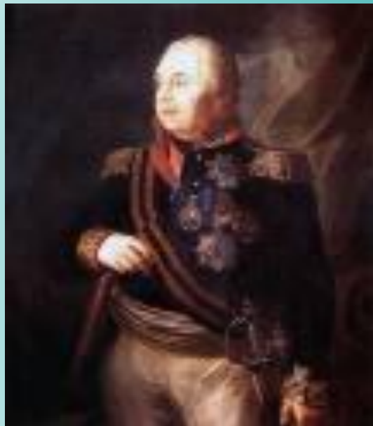
Михаил Илларионович Кутузов