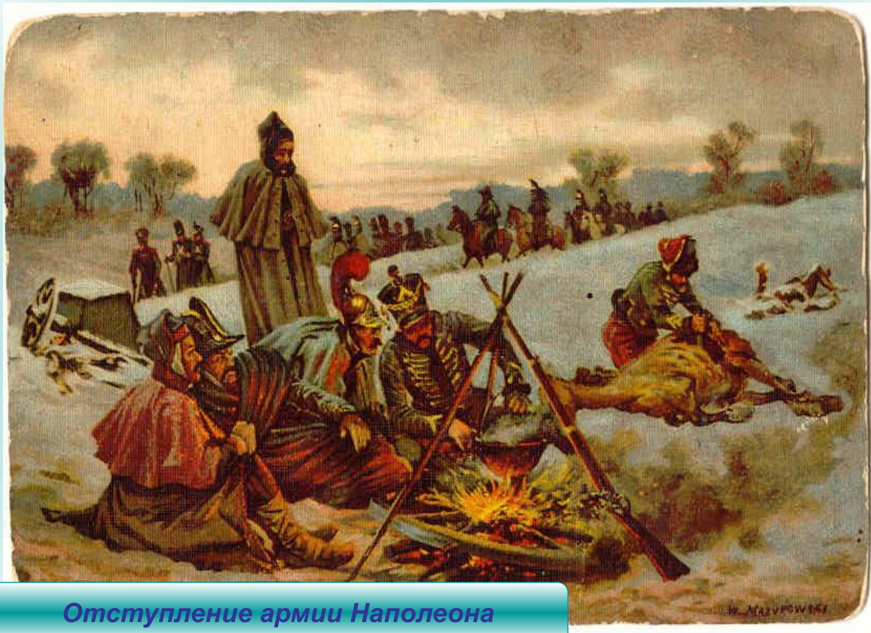
Отступление армии Наполеона