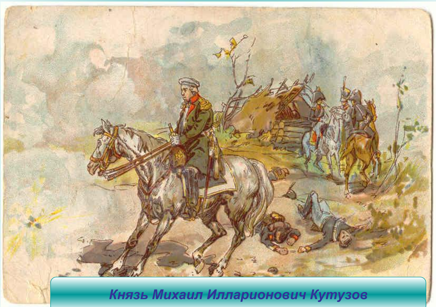
Князь Михаил Илларионович Кутузов