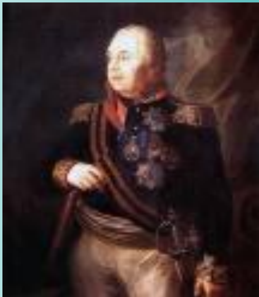
Михаил Илларионович Кутузов