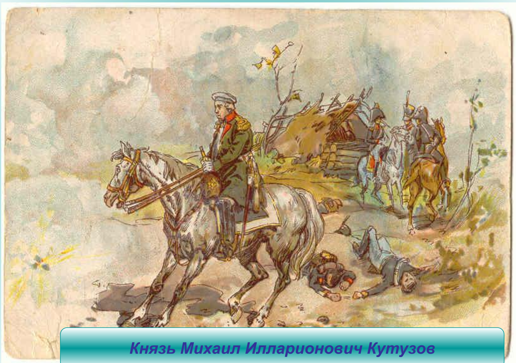
Князь Михаил Илларионович Кутузов