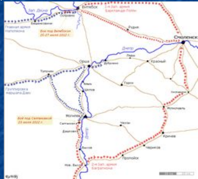
Схема соединения русских армий под Смоленском в начале августа 1812 года.

3 августа русские 1-я и 2-я армии соединились под Смоленском, достигнув таким образом первого стратегического успеха. В войне наступила небольшая передышка, обе стороны приводили в порядок войска, утомленные непрерывными маршами.