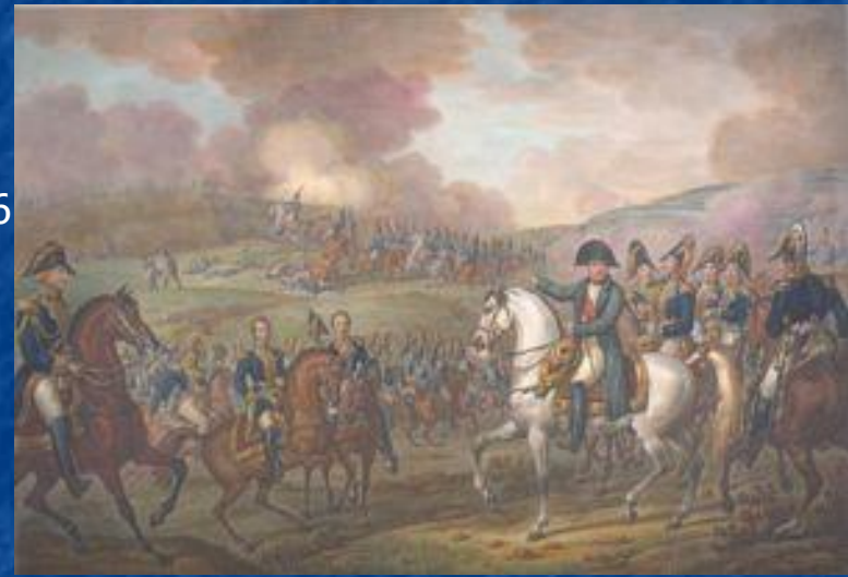
Наполеон в окружении генералов руководит Бородинским сражением. Рисунок из книги XIX в.

Отношения между Багратионом и Барклаем после выхода из Смоленска с каждым днем отступления становились всё напряжённее. 29 августа Кутузов в Царёво-Займище принял армию. В этот день французы вошли в Вязьму.