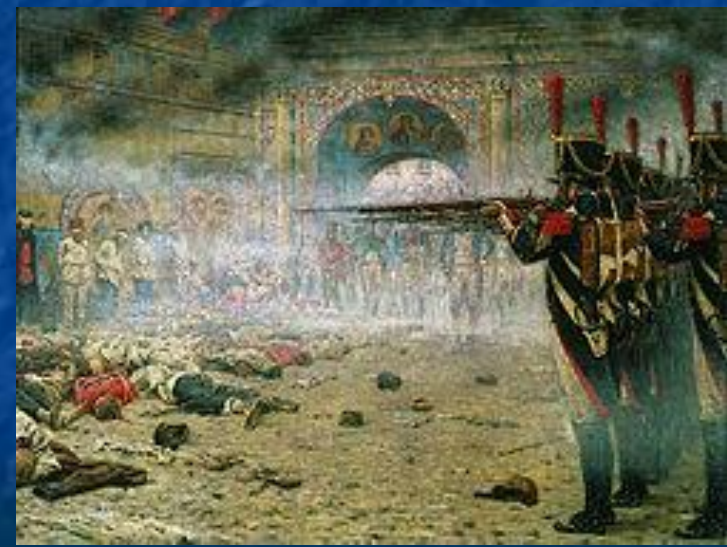
Расстрел предполагаемых поджигателей Москвы французами.