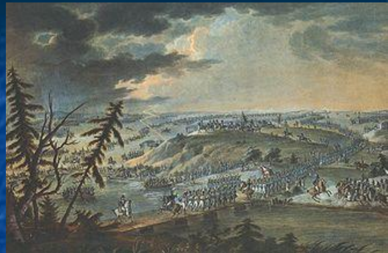
Переправа наполеоновской армии через Неман.

Император Александр I узнал о начале вторжения поздно вечером 24 июня в Вильно (совр. Вильнюс в Литве). А уже 28 июня в Вильно вошли французы. Только 16 июля Наполеон, устроив государственные дела в оккупированной Литве, покинул город вслед за своими войсками.