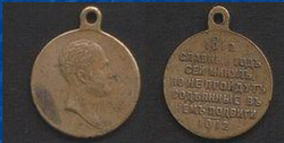
Наградная медаль в честь 100-летия победы в Отечественной войне 1812 года. Надпись: «Славный год сей минул, но не пройдут содеянные в нём подвиги»

■ Александровская колонна — менгир, один из известнейших памятников Петербурга. Воздвигнут в стиле ампир в 1834 году в центре Дворцовой площади архитектором Монферраном по указу Николая I в память о победе над Наполеоном.