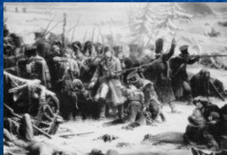
Французские солдаты маршала Нея загнаны в лес в сражении под Красным.