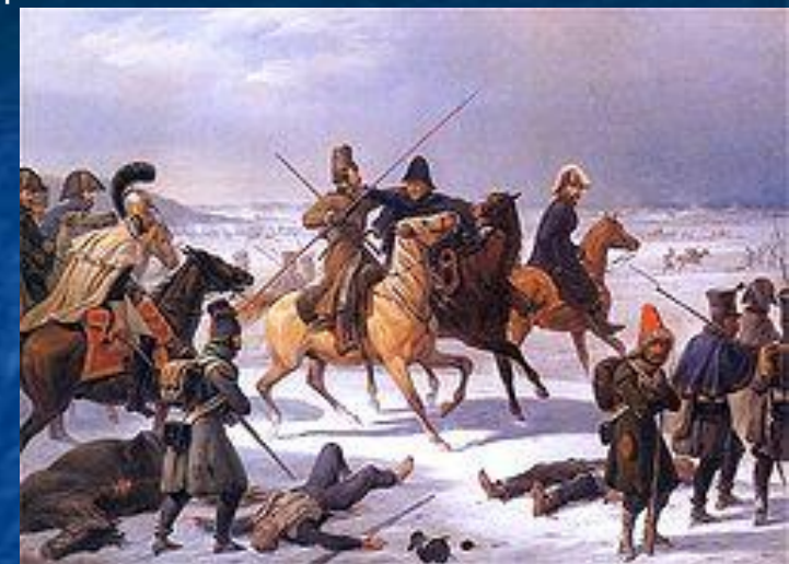
Отход французов из Москвы.

26 октября Наполеон приказал отступать на север на Боровск—Верею—Можайск. Бои за Малоярославец оказались для французов напрасными и лишь задержали их отступление. Из Можайска французская армия возобновила движение к Смоленску той дорогой, по которой наступала на Москву.