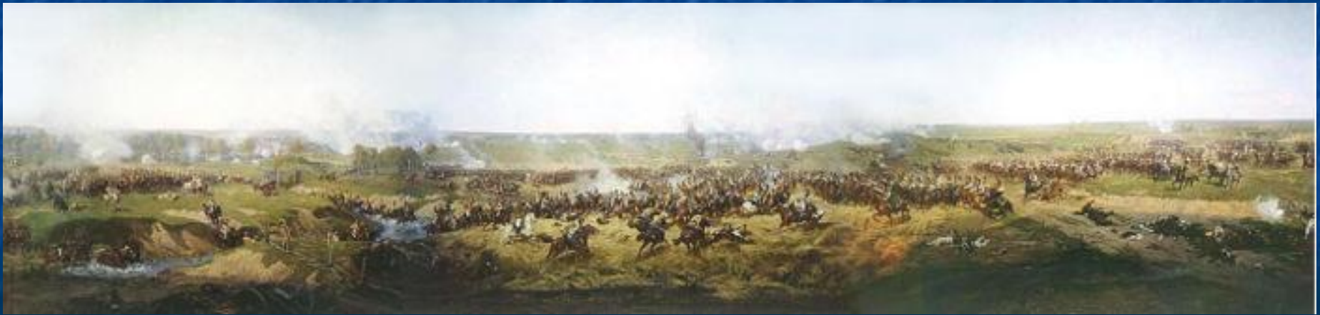
Атака русских кирасир под Бородино. Фрагмент панорамы Бородинского сражения.

14 сентября русская армия прошла через Москву и вышла на Рязанскую дорогу (юго-восток от Москвы). Ближе к вечеру в опустевшую Москву вступил Наполеон.