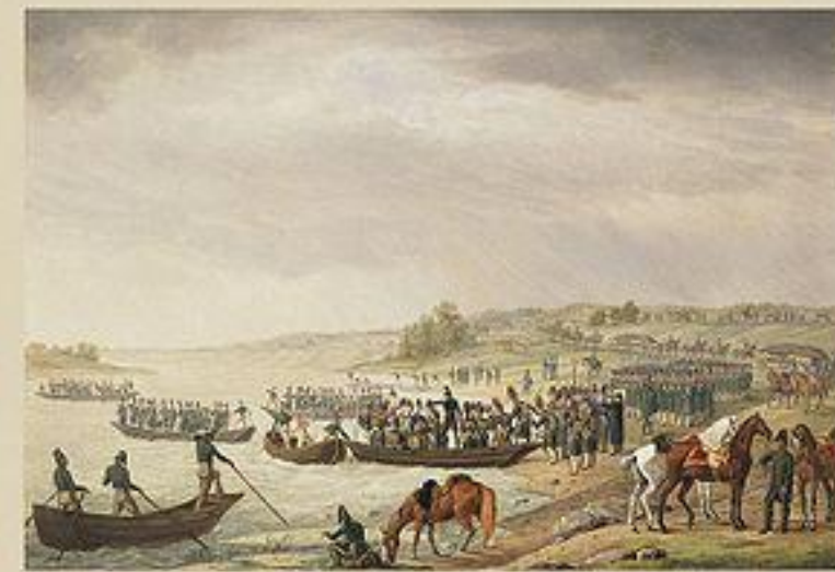
Переправа итальянского корпуса Богарне через Неман 30 июня 1812.