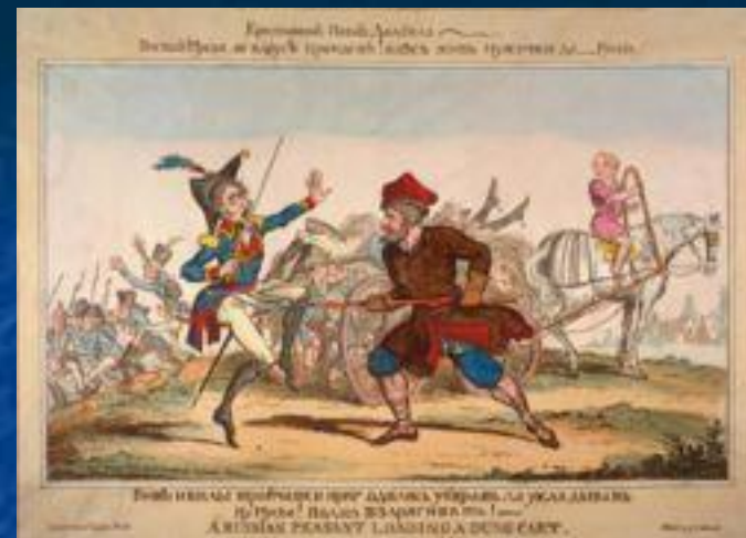
Война русского народа против французов в британской карикатуре 1813 г.

Историк середины XIX века М. И. Богданович проследил пополнения русских армий за время войны по ведомостям Военно-ученого архива Главного штаба. Он посчитал пополнения Главной армии в 134 тыс. человек. Главная армия к моменту занятия Вильно в декабре насчитывала в своих рядах 70 тыс. солдат, а состав 1-й и 2-й западных армий к началу войны был до 150 тыс. солдат. Таким образом общая убыль к декабрю составляет 210 тыс. солдат. Из них, по предположению Богдановича, в строй вернулось до 40 тыс. раненых и больных. Он оценивает потери русской армии в Отечественной войне в 210 тысяч солдат и ополченцев.