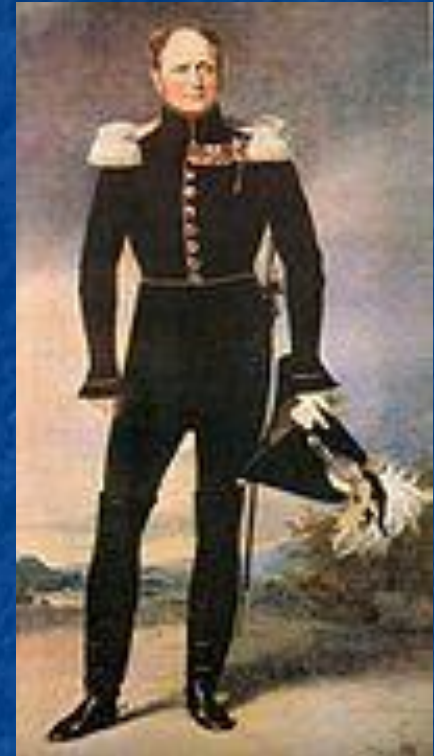
Император Александр I

В 2 часа ночи 24 июня 1812 года Наполеон приказал начать переправу на русский берег Немана через 4 наведённых моста выше Ковно.