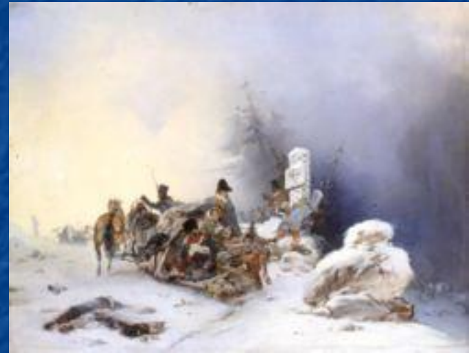
Бегство французов с семьями из России.

14 декабря в Ковно жалкие остатки «Великой Армии» в количестве 1600 человек переправились через Неман в Польшу, а затем в Пруссию. Позднее к ним присоединились остатки войск с других направлений. Отечественная война 1812 года завершилась практически полным уничтожением вторгнувшейся «Великой Армии».