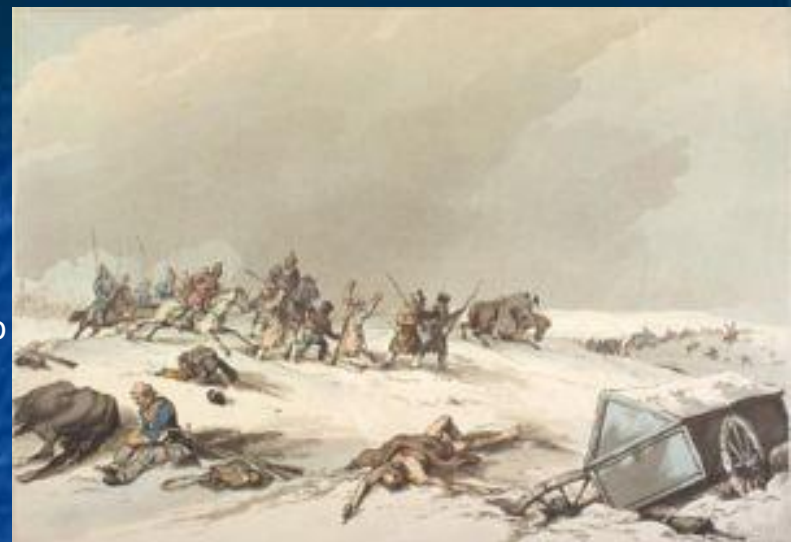
Казаки нападают на отступающих французов.

24 ноября Наполеон подошёл к Березине, оторвавшись от преследовавших его армий Витгенштейна и Кутузова.