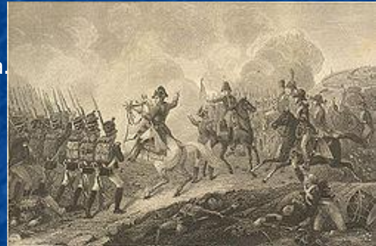
Французская армия продвигается

Кроме Тормасова на южном направлении находился 2-й русский резервный корпус генерал-лейтенанта Эртеля, сформированного в Мозыре и оказывавшего поддержку блокированному гарнизону Бобруйска. Для блокады Бобруйска, а также для прикрытия коммуникаций от Эртеля Наполеон оставил польскую дивизию Домбровского из 5-го польского корпуса.