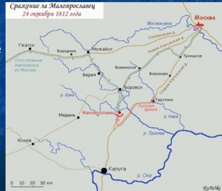
Отступление Наполеона из Москвы. Сражение за Малоярославец.