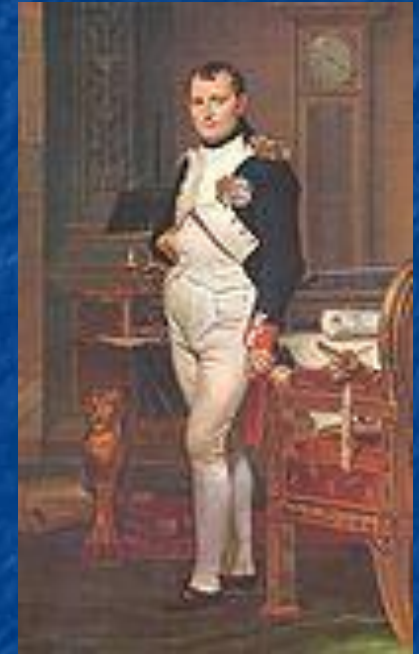
Император Наполеон в 1812 году

Иррегулярные казачьи войска насчитывали по спискам до 110 тысяч легкой кавалерии, однако реально в войне приняло участие до 20 тысяч казаков.