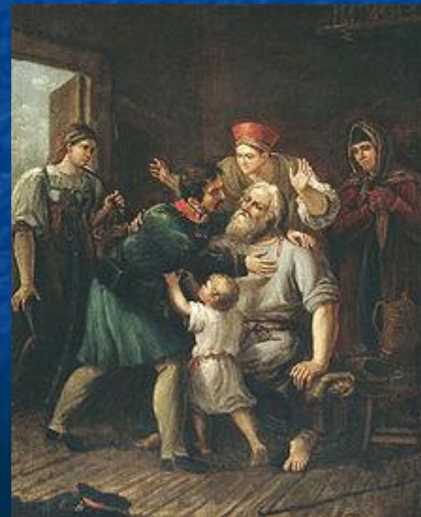
Возвращение ратника домой.