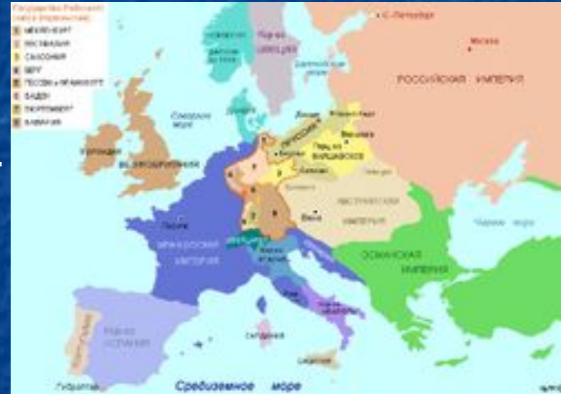
Карта Европы в 1812 году

Наполеон желал провести ограниченную кампанию на 1812 год. Он говорил Меттерниху: «Торжество будет уделом более терпеливого. Я открою кампанию переходом через Неман. Закончу я ее в Смоленске и Минске. Там я остановлюсь.» Французский император рассчитывал на то, что поражение российской армии в генеральном сражении вынудит Александра принять его условия.