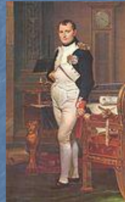
Император Наполеон в 1812 году

Иррегулярные казачьи войска насчитывали по спискам до 110 тысяч легкой кавалерии, однако реально в войне приняло участие до 20 тысяч казаков.