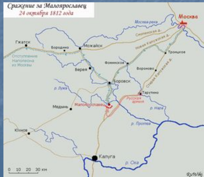
Отступление Наполеона из Москвы. Сражение за Малоярославцем.