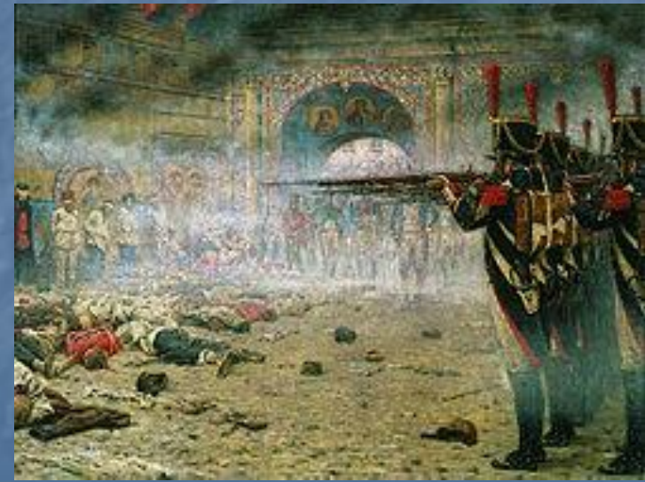
Расстрел предполагаемых поджигателей Москвы французами.