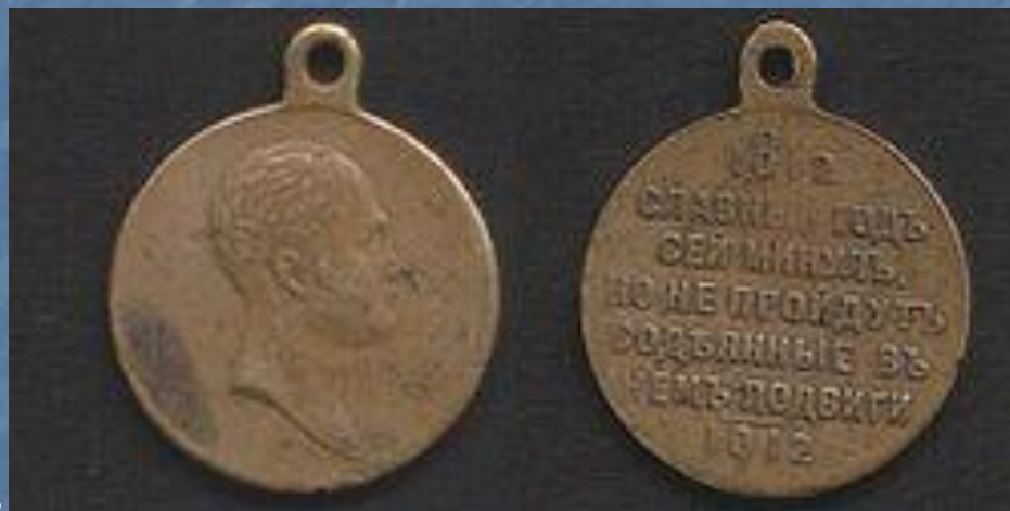
Наградная медаль в честь 100-летия победы в Отечественной войне 1812 года. Надпись: «Славный год сей минул, но не пройдут содеянные в нём подвиги»

■ Александровская колонна — менгир, один из известнейших памятников Петербурга. Воздвигнут в стиле ампир в 1834 году в центре Дворцовой площади архитектором Монферраном по указу Николая I в память о победе над Наполеоном.