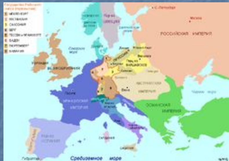
Карта Европы в 1812 году

С самого начала российская сторона планировала длительное организованное отступление с тем, чтобы избежать риска решительного сражения и возможной потери армии. Император Александр I сказал послу Франции в России Арману Коленкуру в частной беседе в мае 1811 года: «Если император Наполеон начнет против меня войну, то возможно и даже вероятно, что он нас побьет, если мы примем сражение, но это ещё не даст ему мира. Испанцы неоднократно были побиты, но они не были ни побеждены, ни покорены. А между тем они не так далеки от Парижа, как мы: у них нет ни нашего климата, ни наших ресурсов. Мы не пойдем на риск. За нас — необъятное пространство, и мы сохраним хорошо организованную армию. [...] Если жребий оружия решит дело против меня, то я скорее отступлю на Камчатку, чем уступлю свои губернии и подпишу в своей столице договоры, которые являются только передышкой. Француз храбр, но долгие лишения и плохой климат утомляют и обескураживают его. За нас будут воевать наш климат и наша зима.»