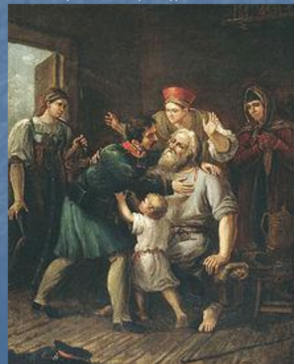
Возвращение ратника домой.