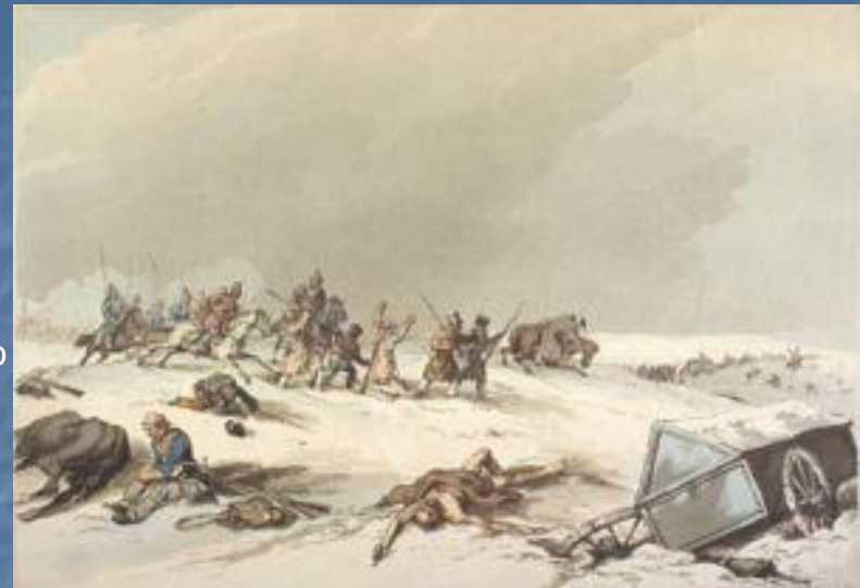
Казаки нападают на отступающих французов.

24 ноября Наполеон подошёл к Березине, оторвавшись от преследовавших его армий Витгенштейна и Кутузова.