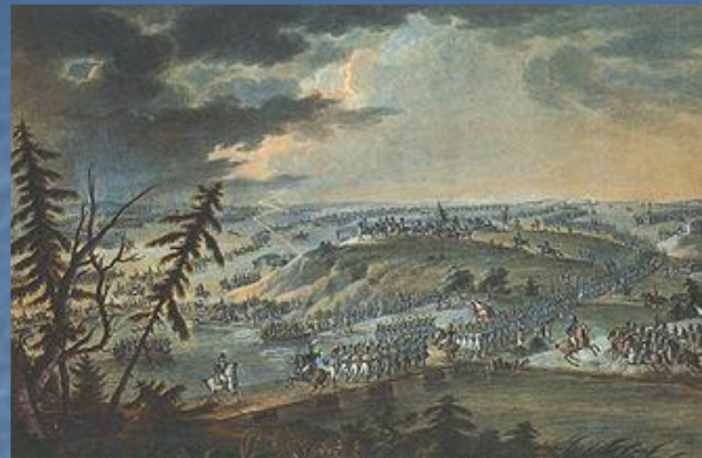
Переправа наполеоновской армии через Неман.

Император Александр I узнал о начале вторжения поздно вечером 24 июня в Вильно (совр. Вильнюс в Литве). А уже 28 июня в Вильно вошли французы. Только 16 июля Наполеон, устроив государственные дела в оккупированной Литве, покинул город вслед за своими войсками.