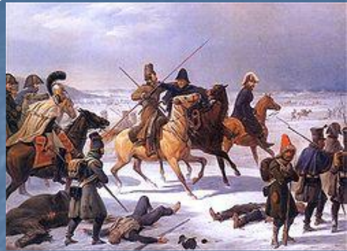
Отход французов из Москвы.

26 октября Наполеон приказал отступать на север на Боровск—Верею—Можайск. Бои за Малоярославец оказались для французов напрасными и лишь задержали их отступление. Из Можайска французская армия возобновила движение к Смоленску той дорогой, по которой наступала на Москву.