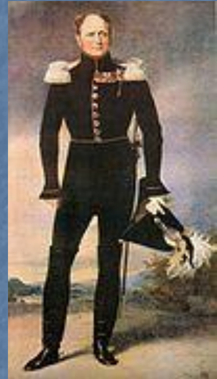
Император Александр I

В 2 часа ночи 24 июня 1812 года Наполеон приказал начать переправу на русский берег Немана через 4 наведённых моста выше Ковно.