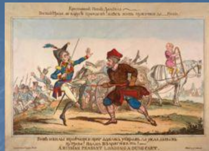
Война русского народа против французов в британской карикатуре 1813 г.

Историк середины XIX века М. И. Богданович проследил пополнения русских армий за время войны по ведомостям Военно-ученого архива Главного штаба. Он посчитал пополнения Главной армии в 134 тыс. человек. Главная армия к моменту занятия Вильно в декабре насчитывала в своих рядах 70 тыс. солдат, а состав 1-й и 2-й западных армий к началу войны был до 150 тыс. солдат. Таким образом общая убыль к декабрю составляет 210 тыс. солдат. Из них, по предположению Богдановича, в строй вернулось до 40 тыс. раненых и больных. Он оценивает потери русской армии в Отечественной войне в 210 тысяч солдат и ополченцев.