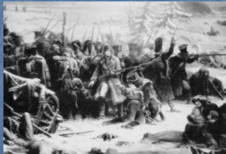
Французские солдаты маршала Нея загнаны в лес в сражении под Красным.