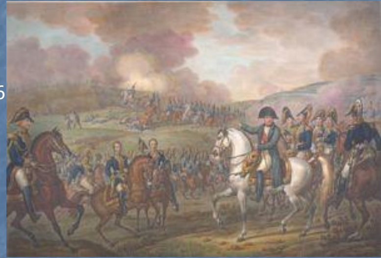
Наполеон в окружении генералов руководит Бородинским сражением. Рисунок из книги XIX в.

Отношения между Багратионом и Барклаем после выхода из Смоленска с каждым днем отступления становились всё напряжённее. 29 августа Кутузов в Царёво-Займище принял армию. В этот день французы вошли в Вязьму.