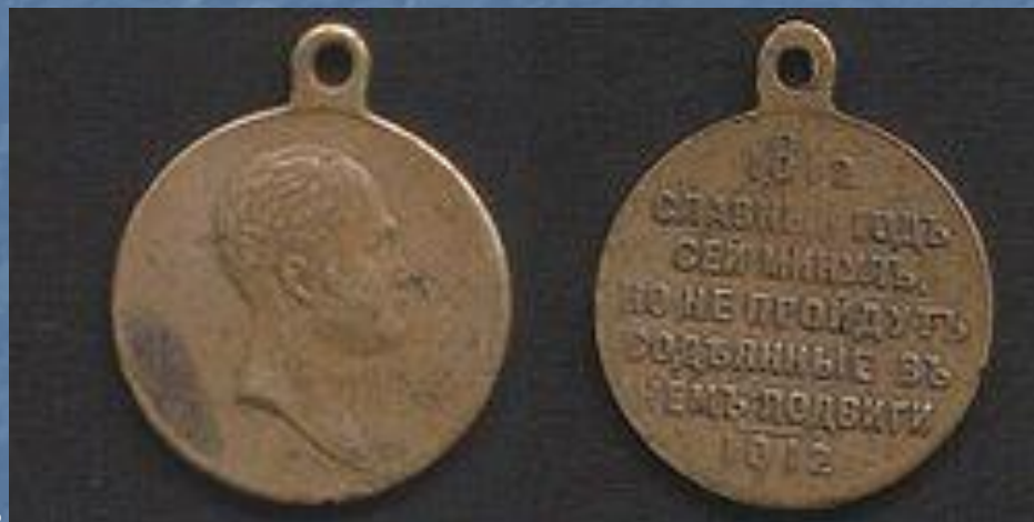
Наградная медаль в честь 100-летия победы в Отечественной войне 1812 года. Надпись: «Славный год сей минул, но не пройдут содеянные в нём подвиги»

■ Александровская колонна — менгир, один из известнейших памятников Петербурга. Воздвигнут в стиле ампир в 1834 году в центре Дворцовой площади архитектором Монферраном по указу Николая I в память о победе над Наполеоном.