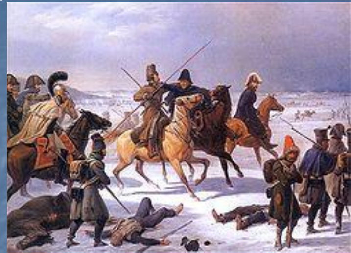
Отход французов из Москвы.

26 октября Наполеон приказал отступать на север на Боровск—Верею—Можайск. Бои за Малоярославец оказались для французов напрасными и лишь задержали их отступление. Из Можайска французская армия возобновила движение к Смоленску той дорогой, по которой наступала на Москву.