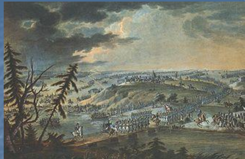
Переправа наполеоновской армии через Неман.

Император Александр I узнал о начале вторжения поздно вечером 24 июня в Вильно (совр. Вильнюс в Литве). А уже 28 июня в Вильно вошли французы. Только 16 июля Наполеон, устроив государственные дела в оккупированной Литве, покинул город вслед за своими войсками.