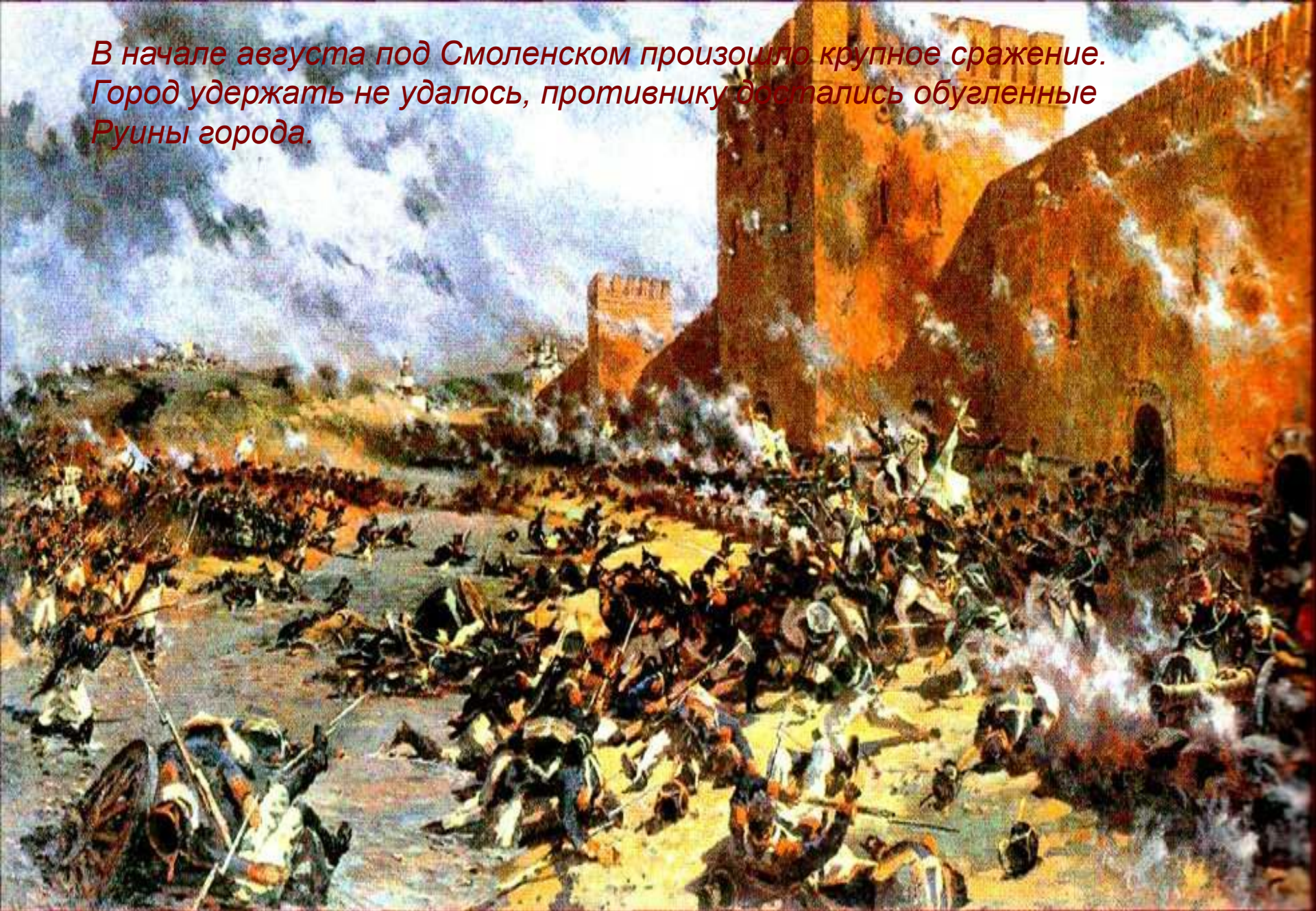
Оборона Смоленска. Худ. П. Кривоногов, 1966 г.

В начале августа под Смоленском произошло крупное сражение. Город удержать не удалось, противнику достались обугленные Руины города.