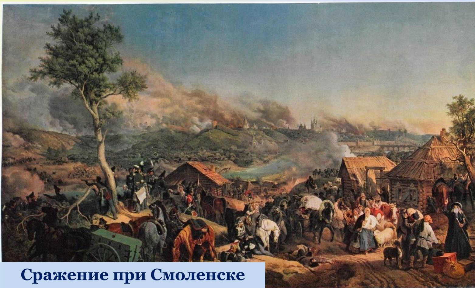
Сражение при Смоленске

22 июля у Смоленска произошло первое грандиозное сражение. Но русским войскам пришлось отступить и сдать город.