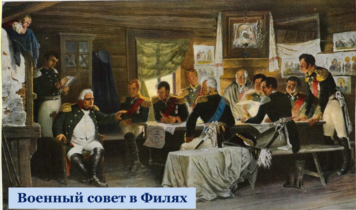
Военный совет в Филях

Кутузов собрал всех генералов в деревне Филя на военный совет. Нелёгкий выбор встал перед русским командованием: давать ли под Москвой ещё одно сражение или оставить Москву неприятелю, но сберечь войско? Решающими стали слова Кутузова «Пока цела армия, цела и Россия». Было решено оставить Москву.