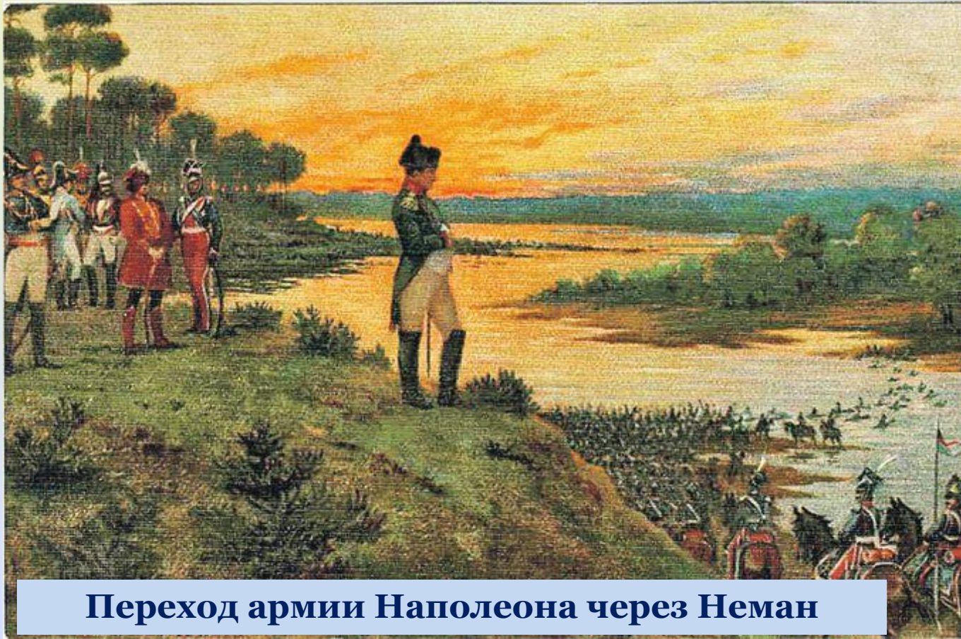
Переход армии Наполеона через Неман