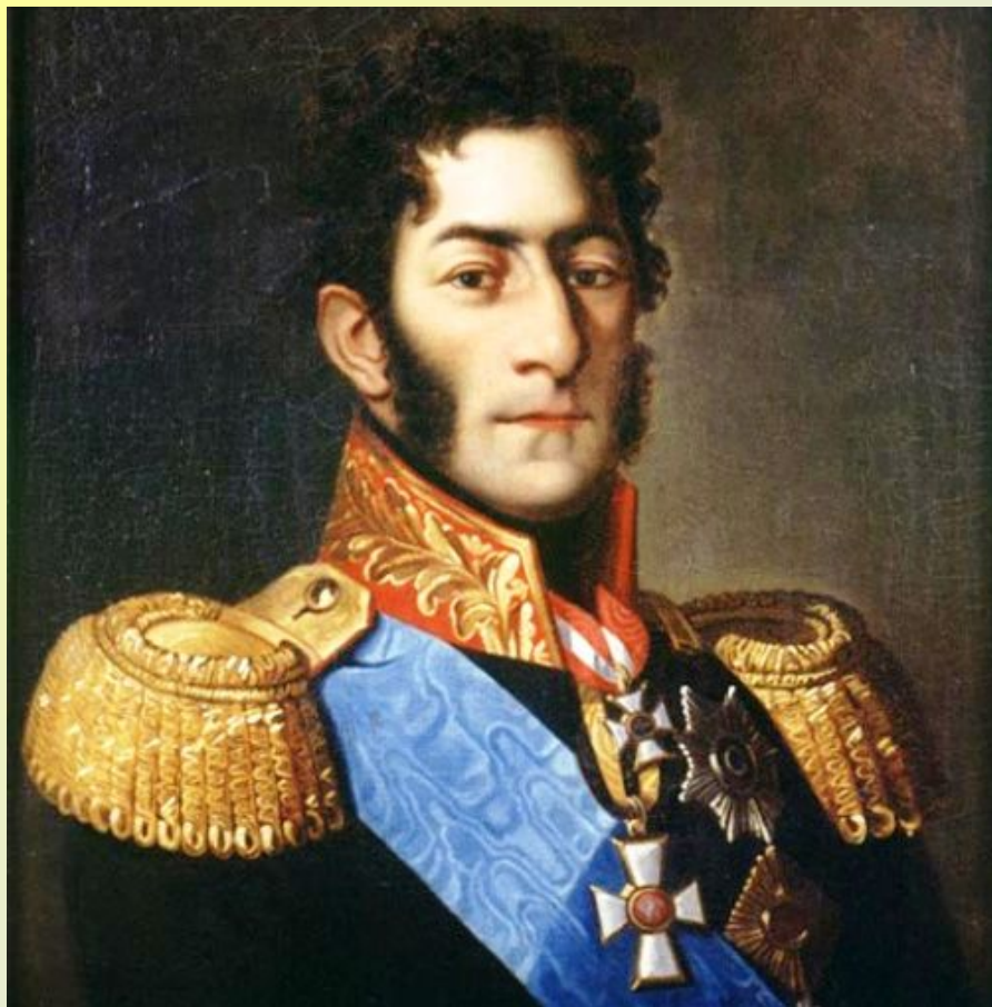
Багратион Петр Иванович