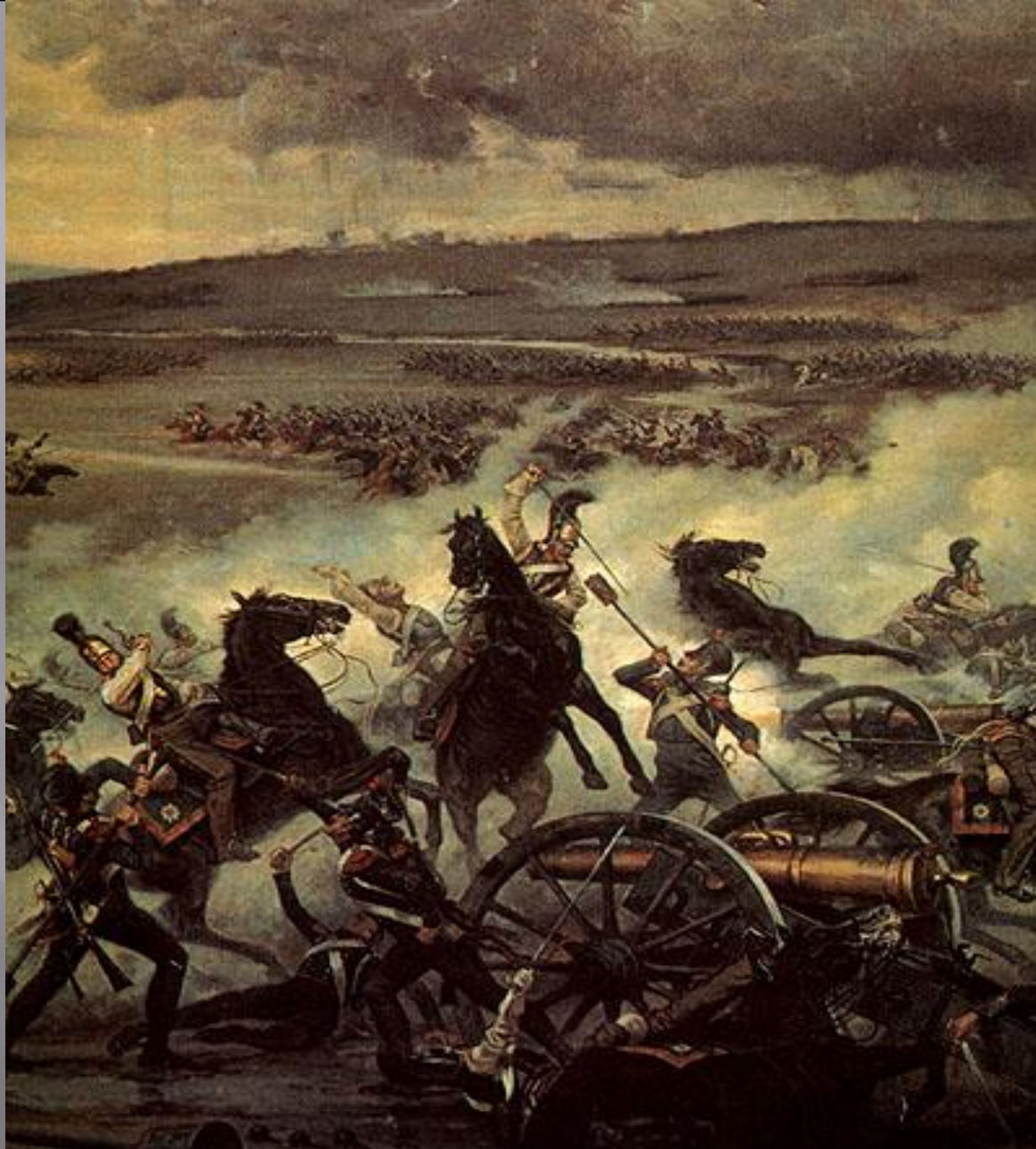
Атака русской кавалерии на французскую батарею в сражении при Бородине.