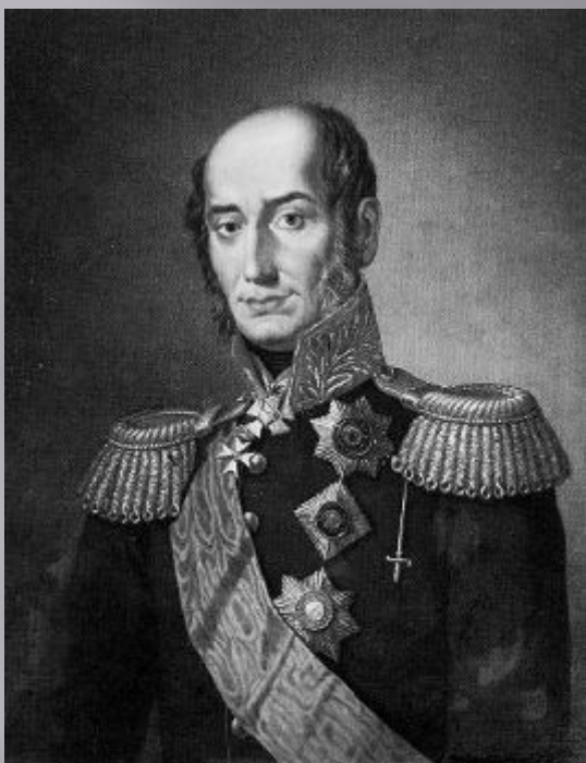
Барклай де Толли