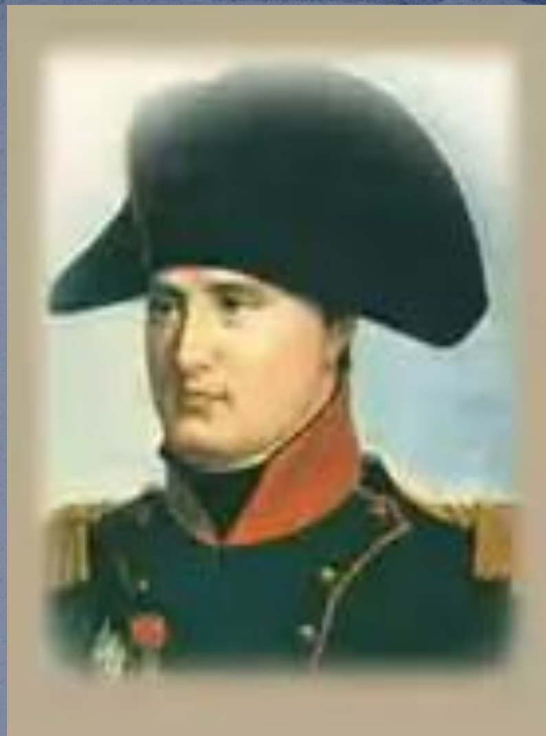
Полководец французской армии Наполеон Бонапарт.

В 1812 году французская армия под руководством Наполеона вторглась в Россию. Удар врага был так силен, что русские войска не смогли сдержать натиск противника. Началось отступление.