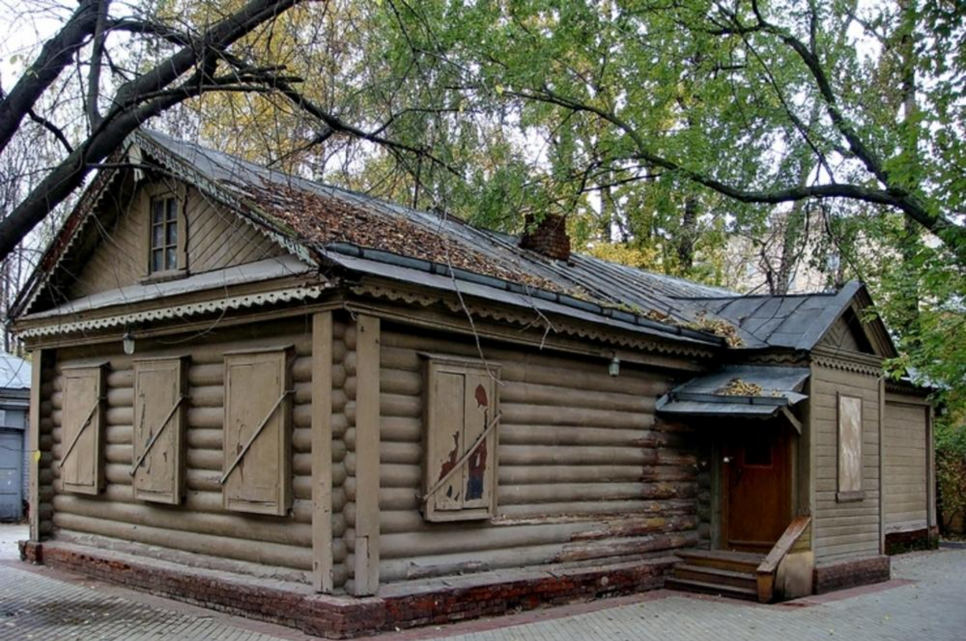
Кутузовская изба в Филях