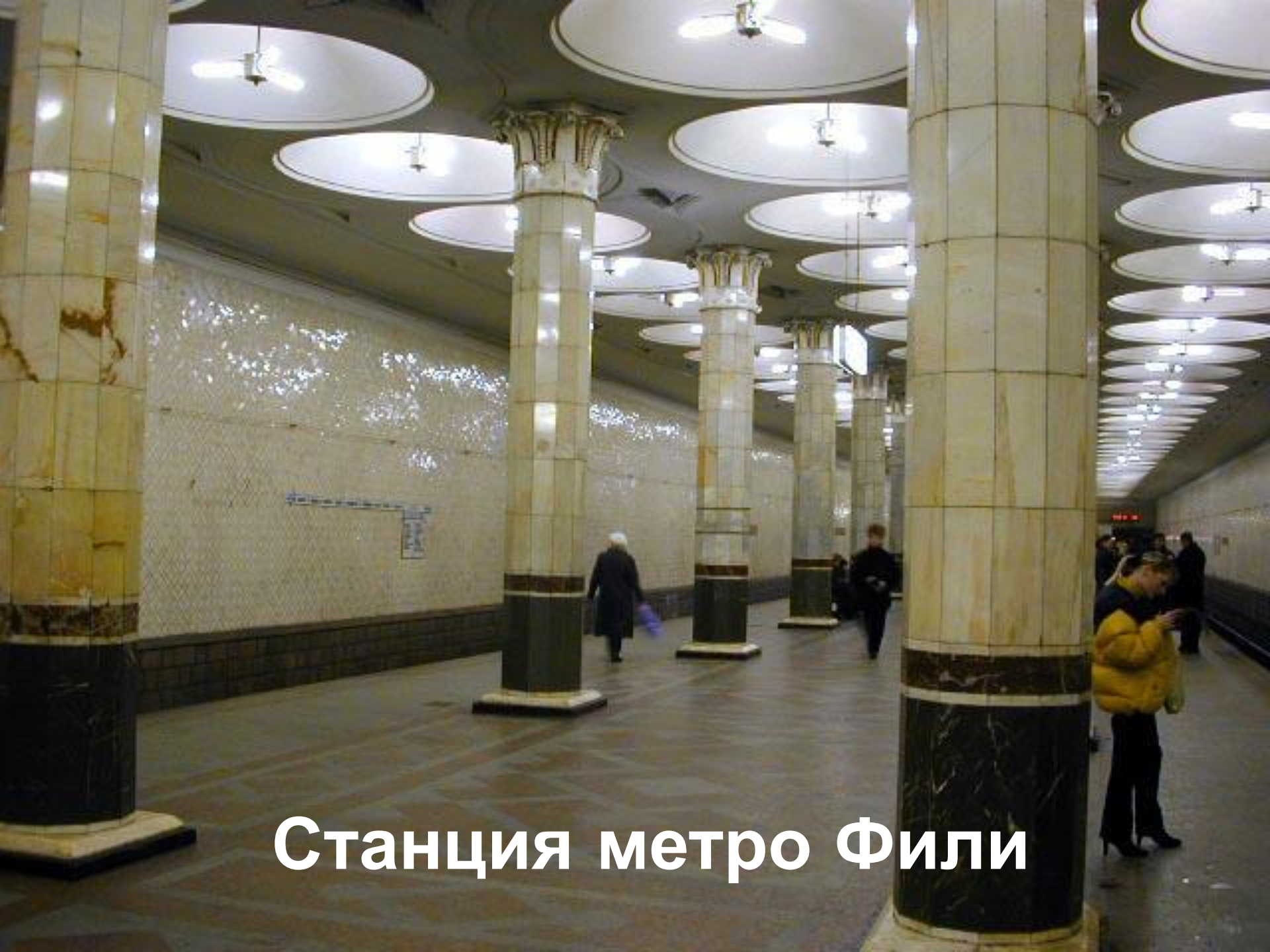
Станция метро Фили