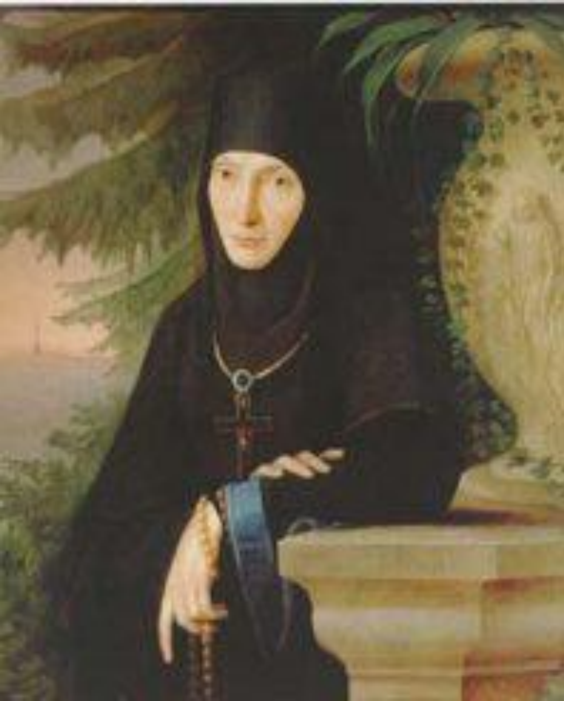
Тучкова Маргарита Михайловна – основательница Спасо- Бродинского монастыря