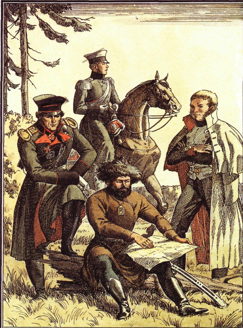
Капитан А.Н.Сеславин, полковник Н.Д.Кудашев, подполковник Д.В.Давыдов, штаб-капитан А.С.Фигнер