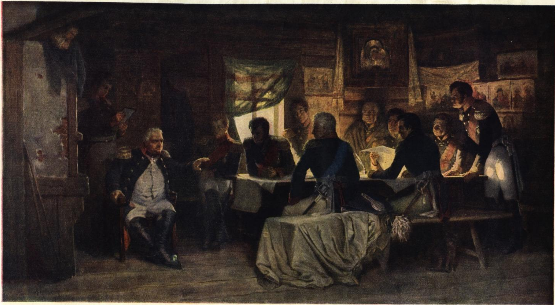
А. Д. Кившенко (1851—1895)