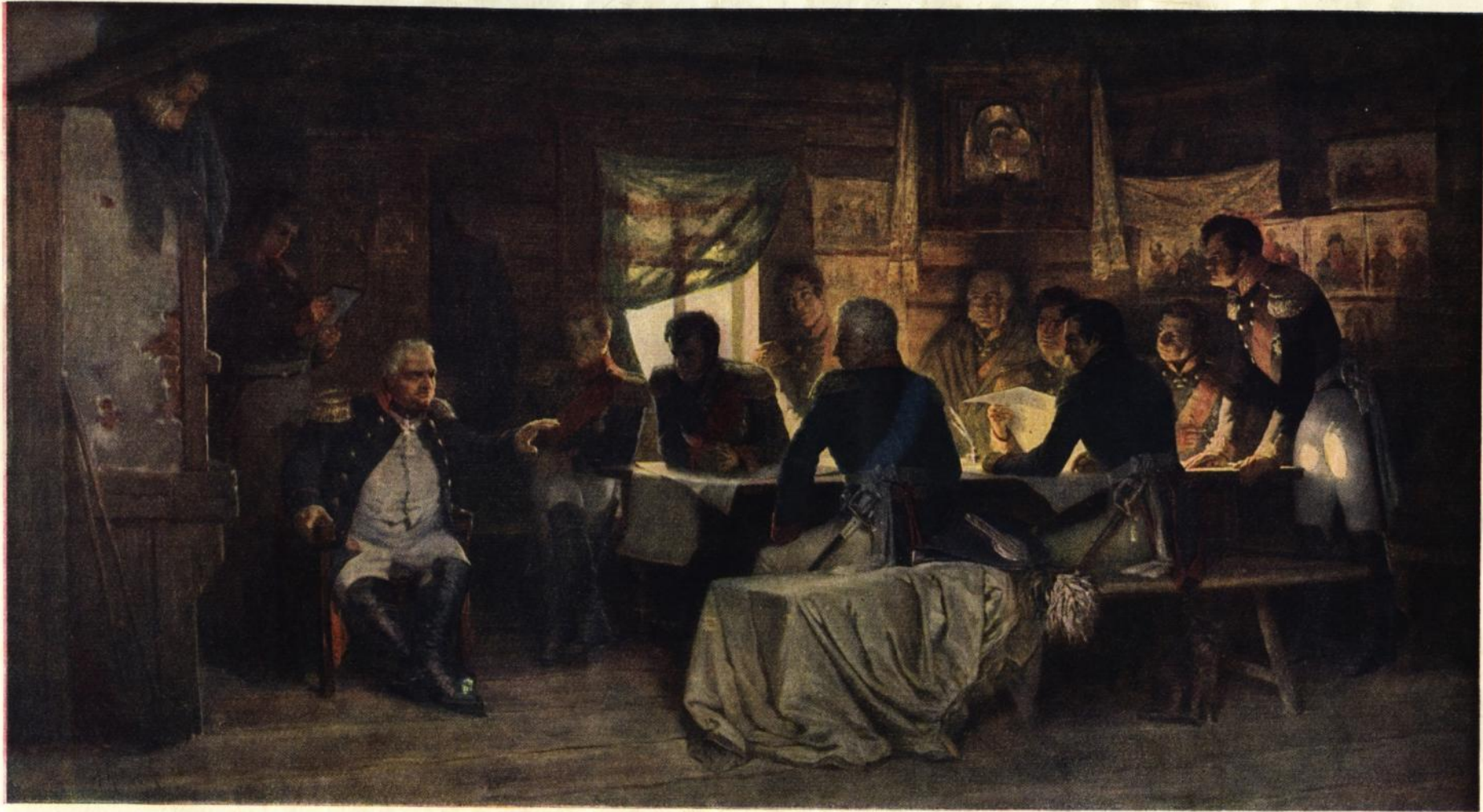
А. Д. Кившенко (1851—1895)