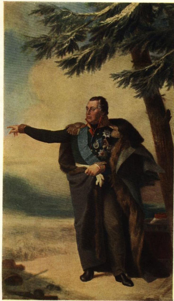
М. И. КУТУЗОВ.

Портрет работы художника Дж. Доу. 1829. Государственный Эрмитаж. Ленинград.