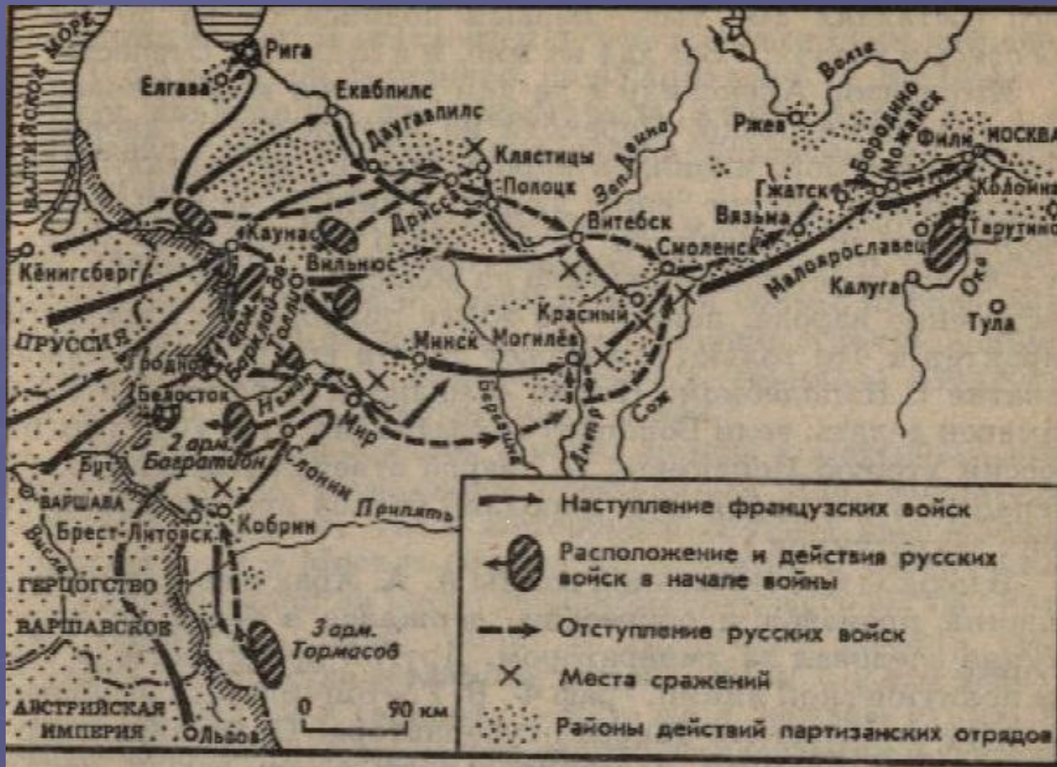
Нашествие армии Наполеона на Россию