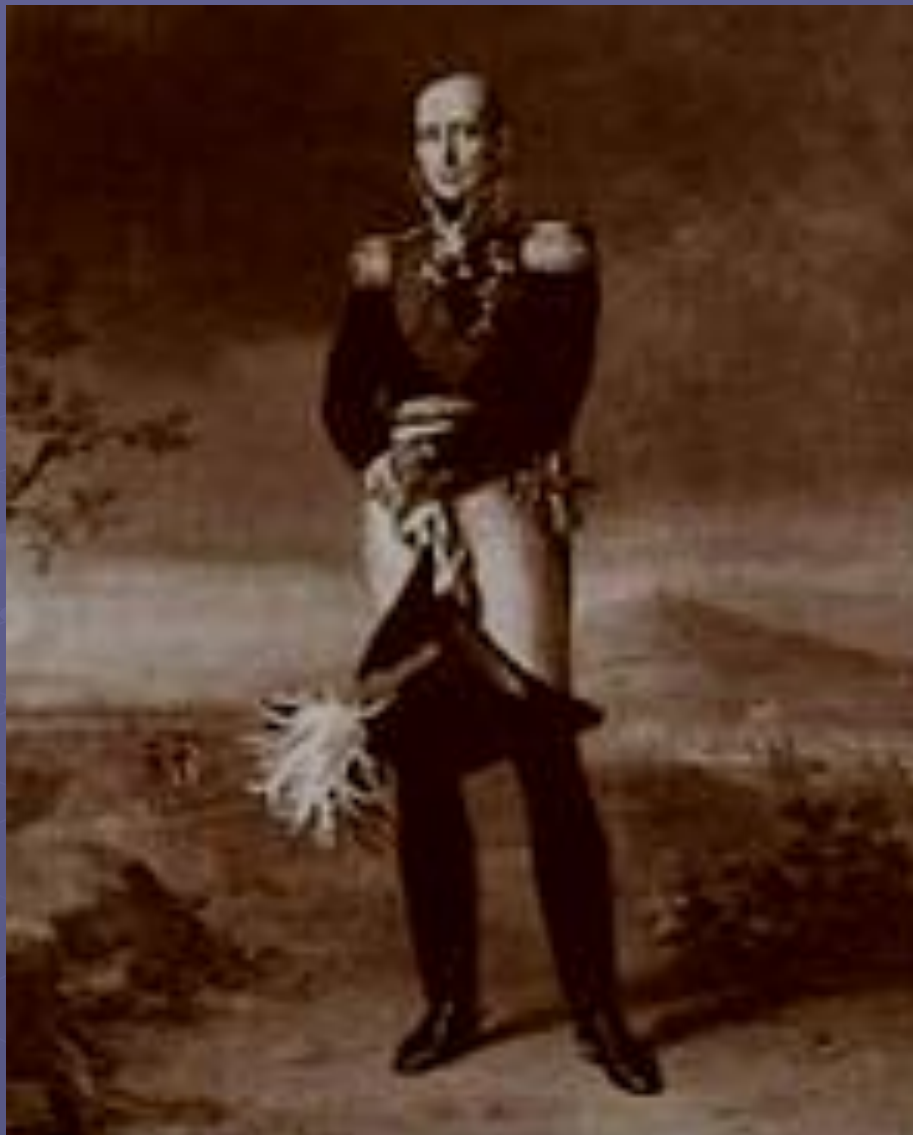
М.Б.Барклай – де – Толли (1757-1818гг.)