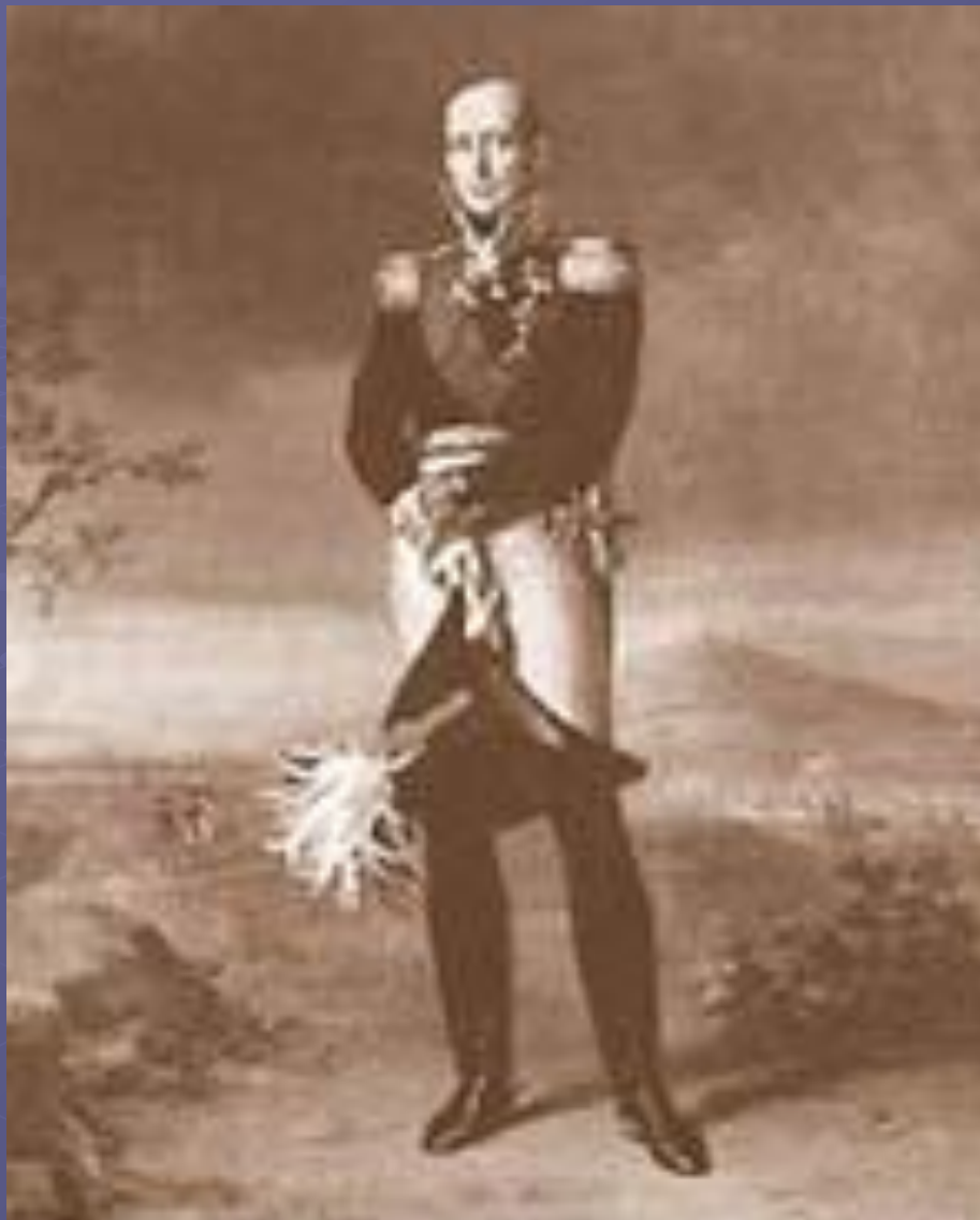
М.Б.Барклай – де – Толли (1757-1818гг.)