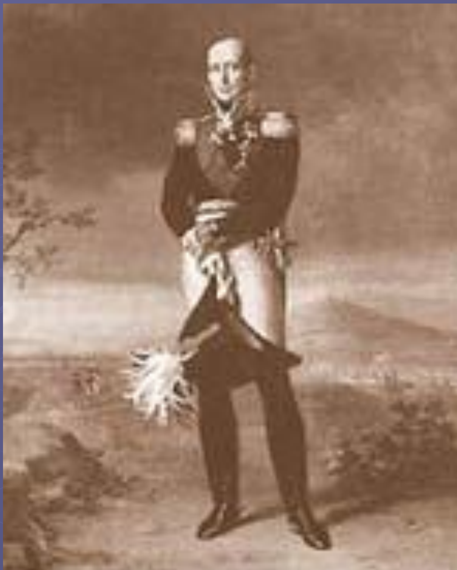
М.Б.Барклай – де – Толли (1757-1818гг.)