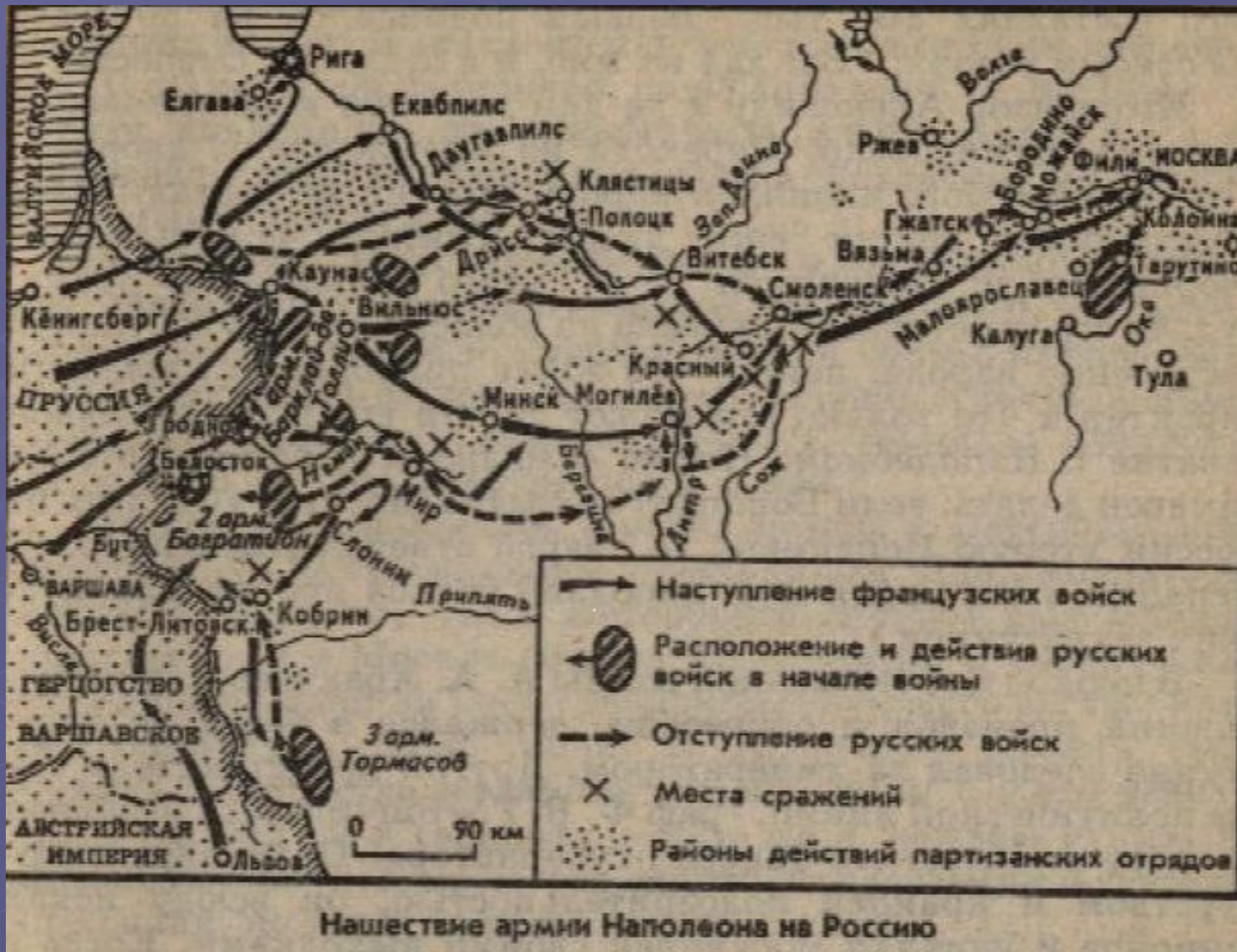
Нашествие армии Наполеона на Россию