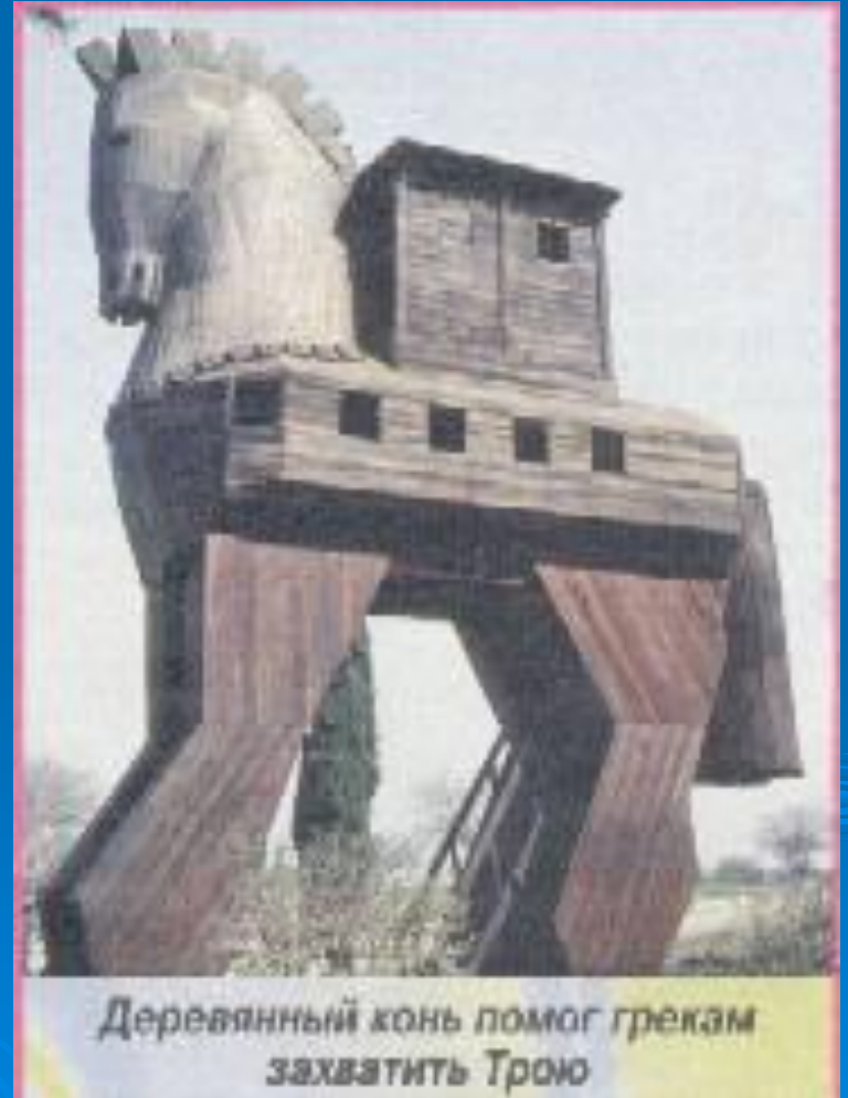
Деревянный конь помог грекам захватить Трою

Durch seine sensationellen Ausgrabungen wurde Schliemanns Werk weltberühmt, aber zugleich umstritten.