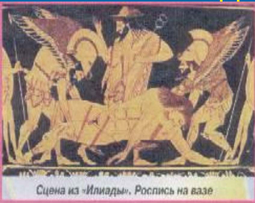
Сцена из «Илиады». Роспись на вазе

Среди находок Шлимана было оружие, украшения, драгоценные сосуды, различные вазы свидетельства того, что здесь некогда жили люди высокой культуры.