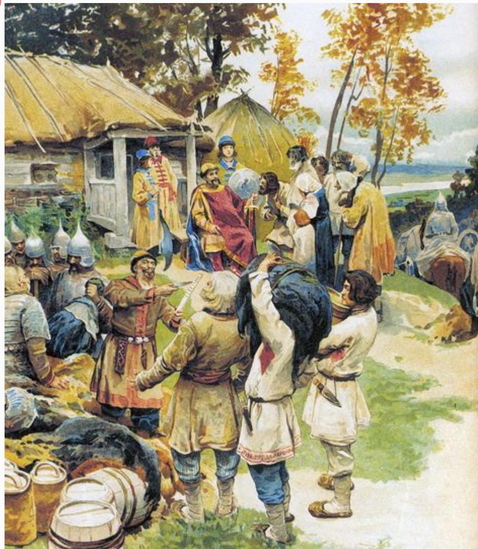
Лебедев К.В. Сбор дани. Полюдьё