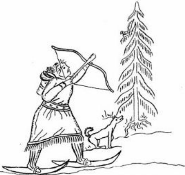
Охотник стреляет в белку из лука. деталь шторки (панно) XIX в.