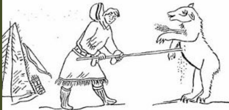
Охота с луком и рогатиной на медведя. Деталь шторки (панно). XIX в.