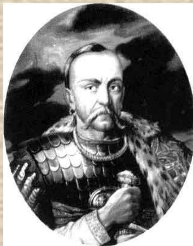
Князь Игорь 912-945гг.