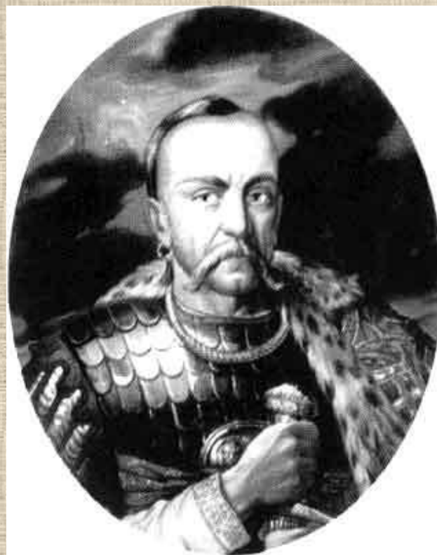
Князь Игорь 912-945гг.