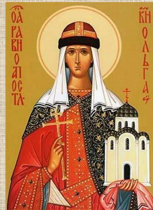
Княгиня Ольга 945 – 957 гг.