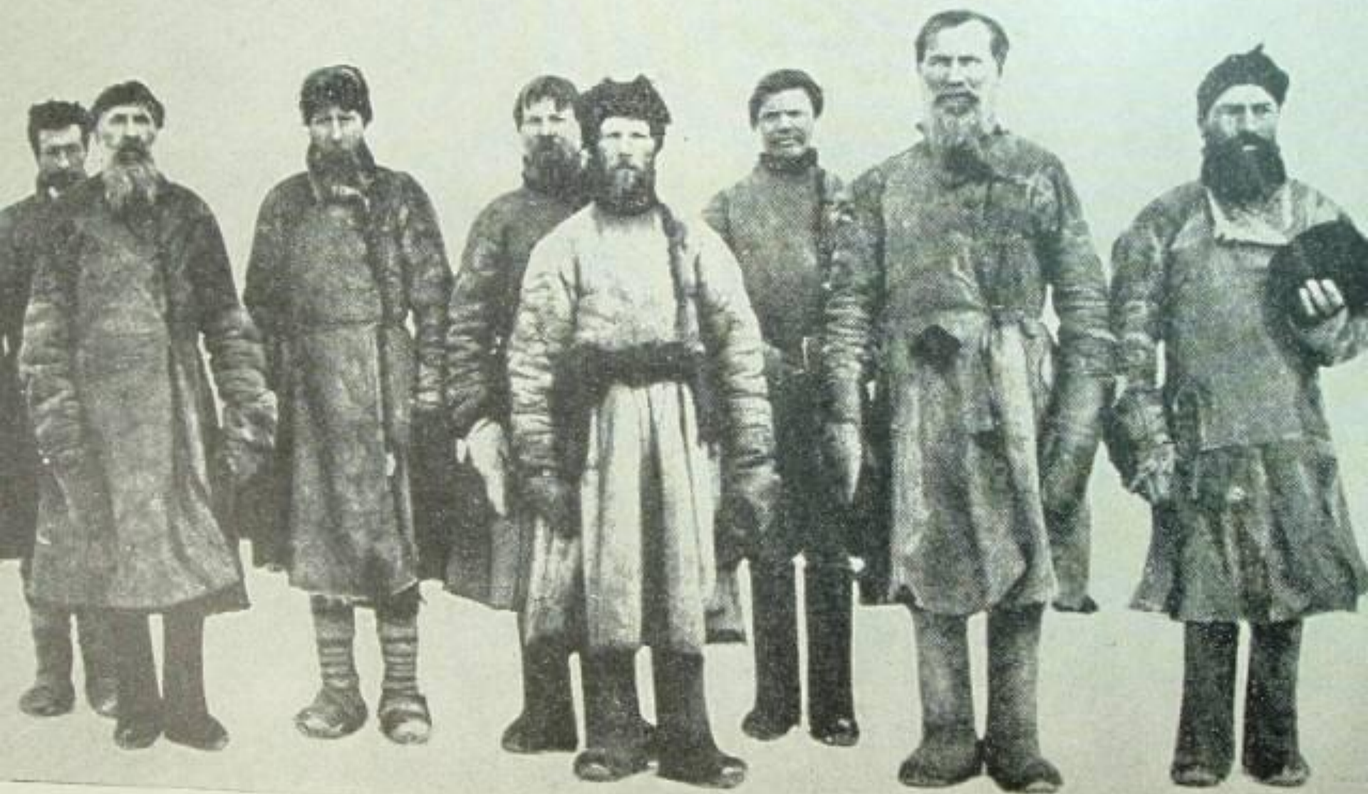
PEASANTS IN WINTER CLOTHING