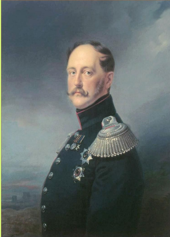
Портрет императора Николая I - (копия с оригинала Ф.Крюгера)

«Сдаю тебе мою команду, но, к сожалению, не в таком порядке, как желал. Оставляю тебе много трудов и забот» — говорил, умирая, Николай I.