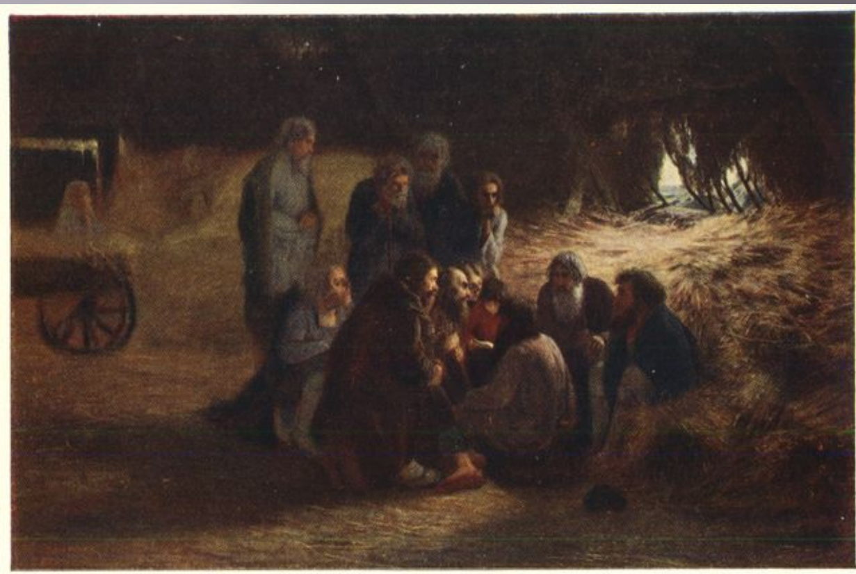
Мясоедов Григорий Григорьевич (1834-1911)