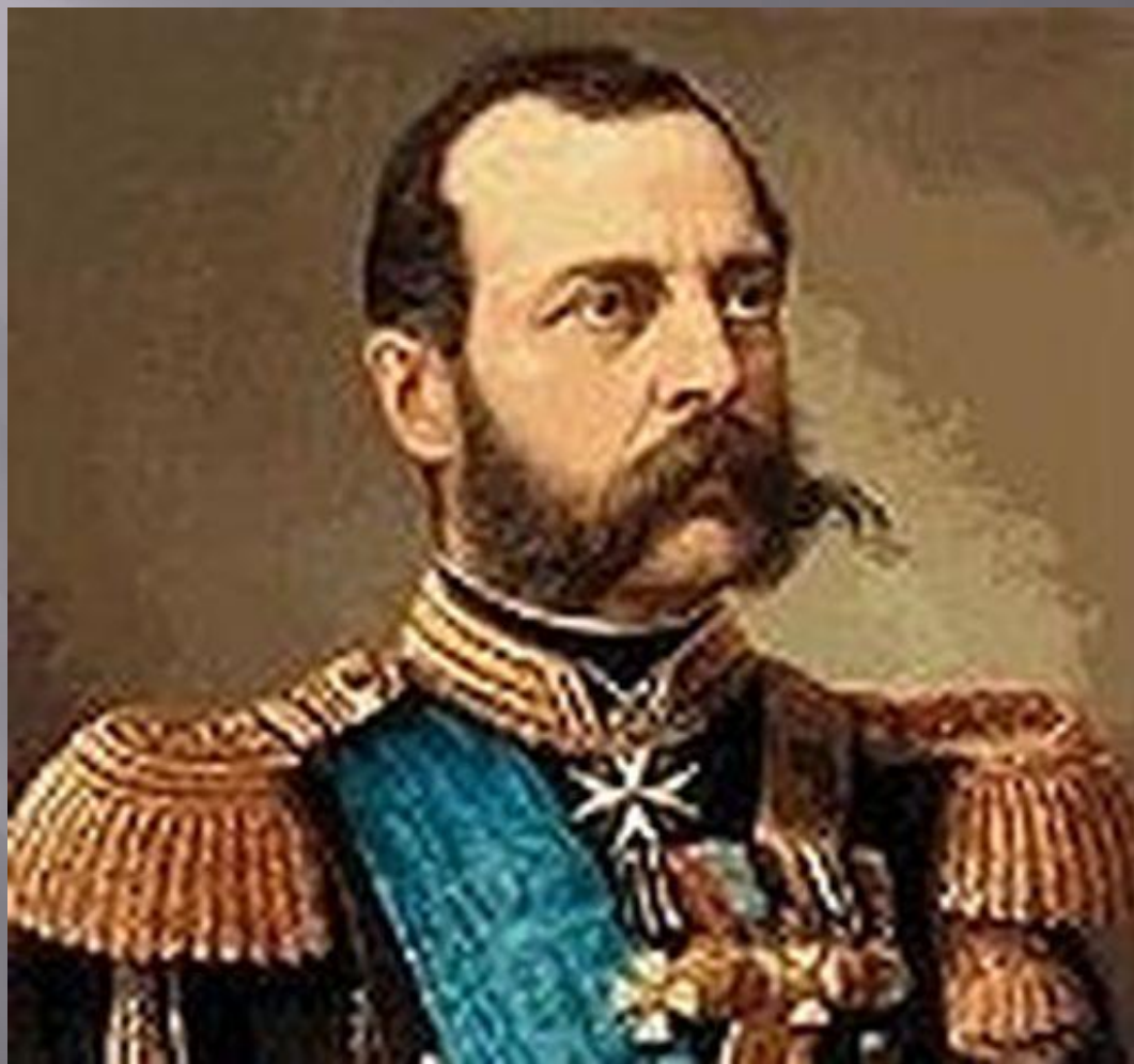
Александр 2 Освободитель