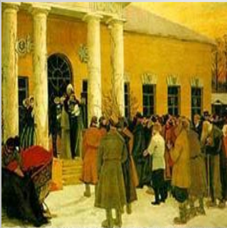
Б. Кустодиев "Освобождение крестьян"