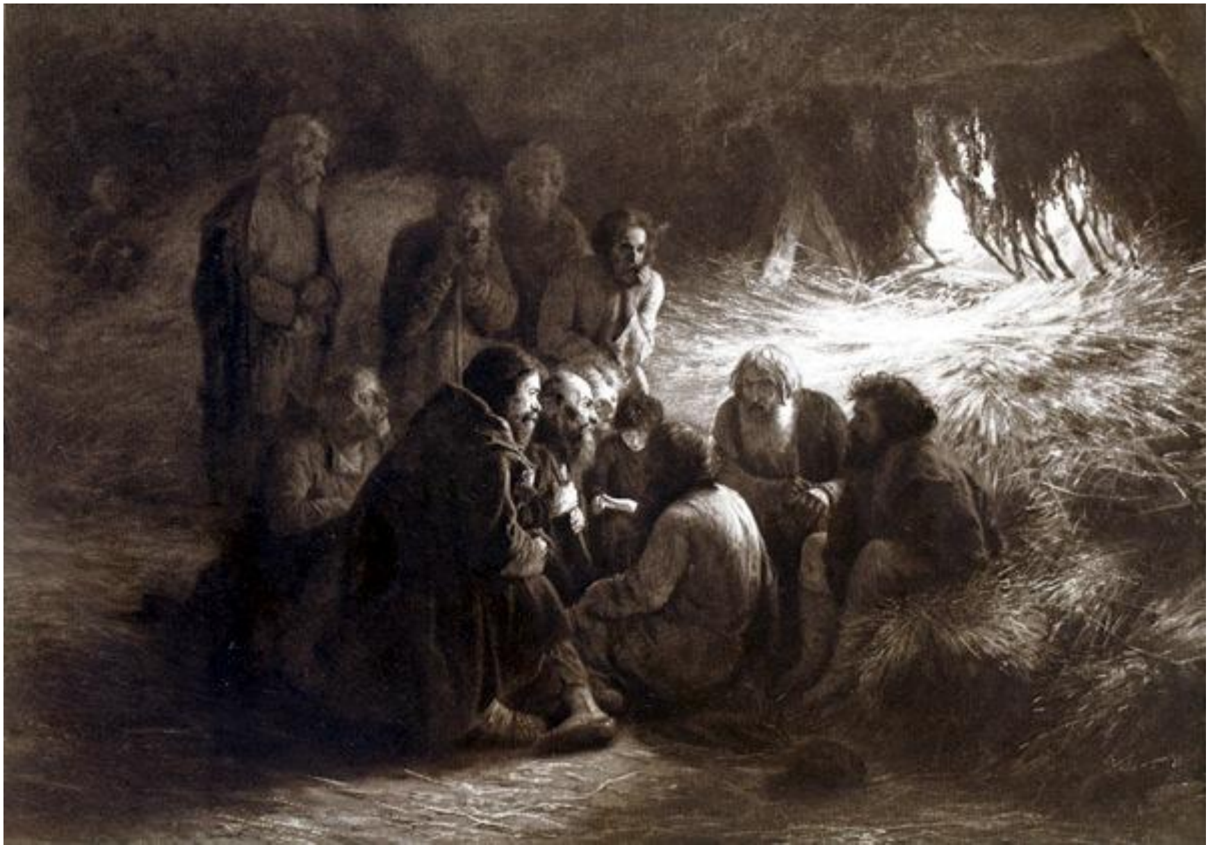
Г.Г. Мясоедов. Чтение манифеста 19 февраля 1861 г.