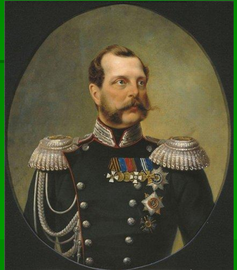
В.И.Назимов, Положивший начало Крестьянской реформе 1861 г