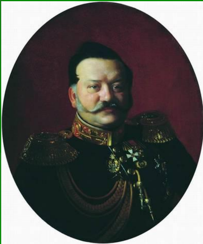
Я.И.Ростовцев, генерал, Член Государственного Совета