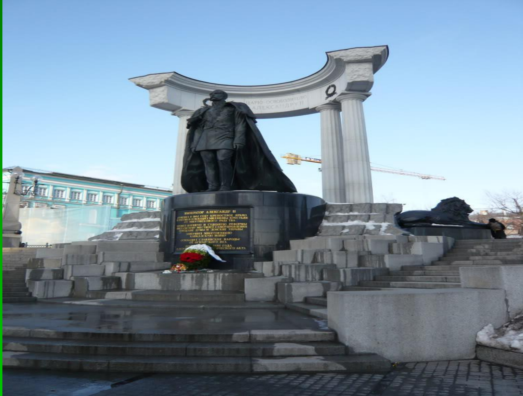
Памятник Александру II - освободителю