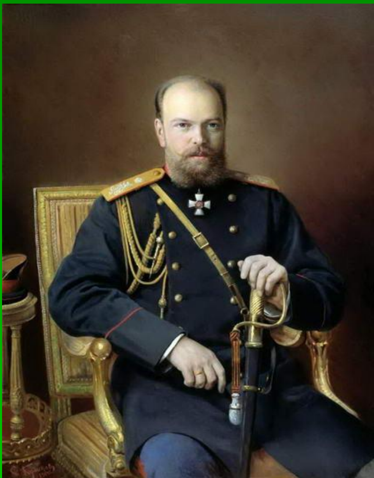
Александр II (1855-1881)