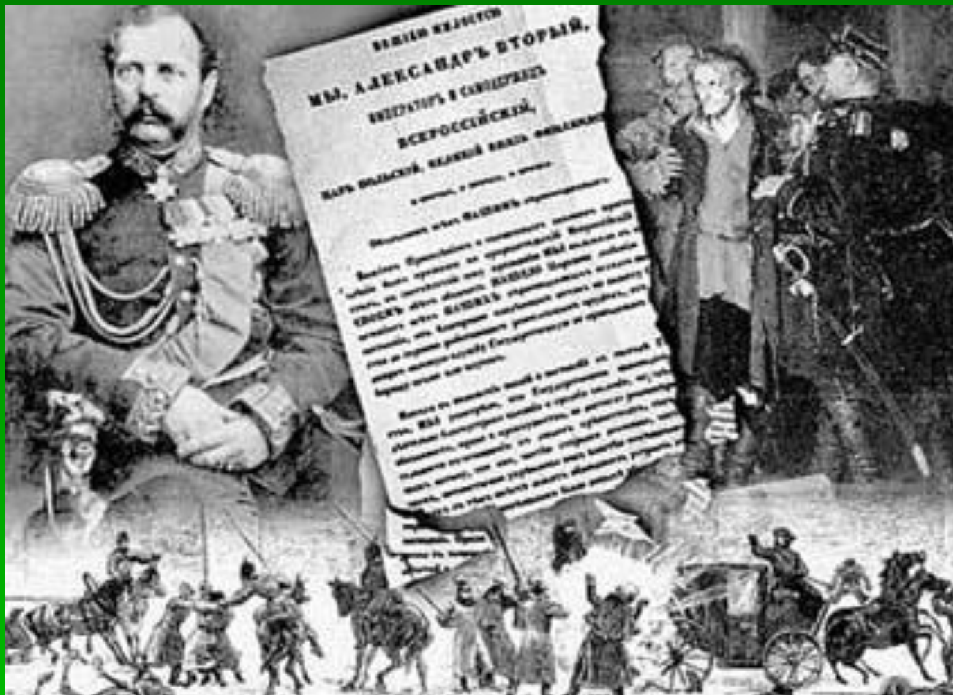
День отмены крепостного права в России