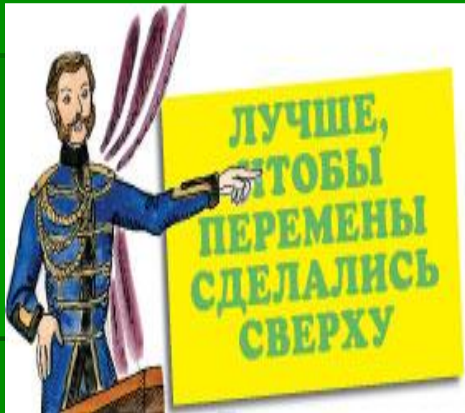
Манифест об отмене Крепостного права

Въвиду на возможность жизни и состояній къ состояній Государства, МЫ усмотрѣли, что Государственное законодательство, должно было строена жизнью и состояній ослѣдствіи, определяя къ обязанности, права и преимуществу, не только равномерной деятельности къ отомъ и къ жизни крестьянскія, така исключая потому, что они, частію старыми закономъ, частію обязанность, состояніемъ крестьянскія подъ клячимъ состояніемъ, на по-термъ съ МЫ всѣмъ людямъ обязанность заботиться къ благо-состоянію. Промышленнаго была возложена обязанность или определяемъ съ точностію закономъ, всѣмъ которыхъ поступали преданіи, обязанъ и доброй волей крестьянскія. Въ думанскія случаемъ къ отомъ