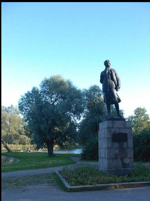
Памятник Зое Космодемьянской