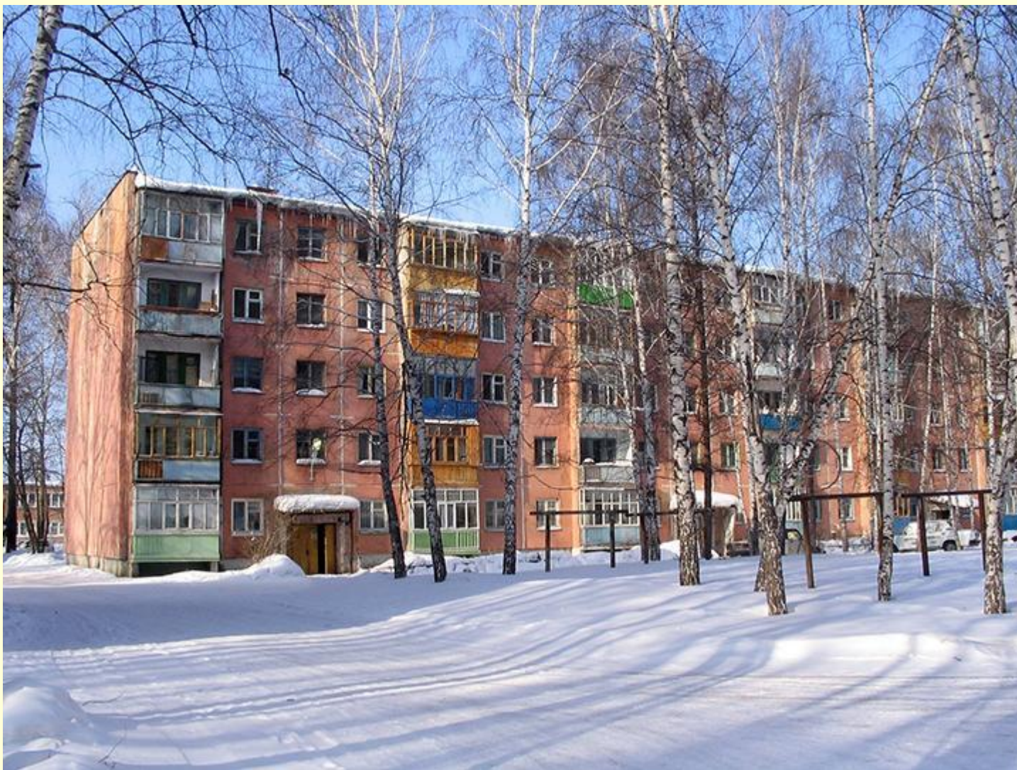
«Хрущевка». Современное фото. Улица Кулагина, Томск