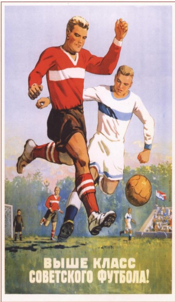
509. Кокорекин А. Выше класс советского футбола! 1954