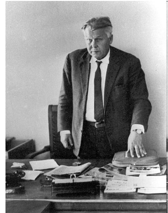
Александр Трифонович Твардовский

Власть признала публикацию этих работ «вредной» и отстранила А. Твардовского от руководства журналом