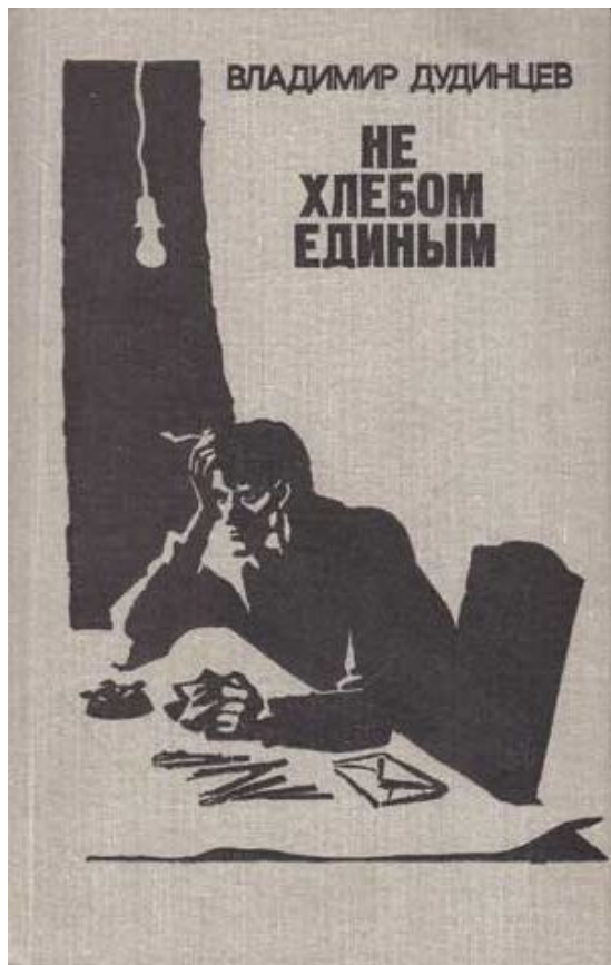
1956 г. – «Не хлебом единым» В. Дудинцев