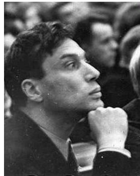
Борис Леонидович Пастернак

не был ни расстрелян, ни посажен в тюрьму