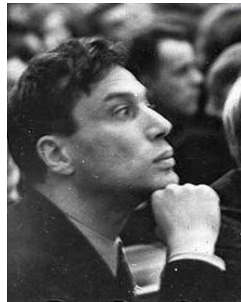
Борис Леонидович Пастернак

не был ни расстрелян, ни посажен в тюрьму