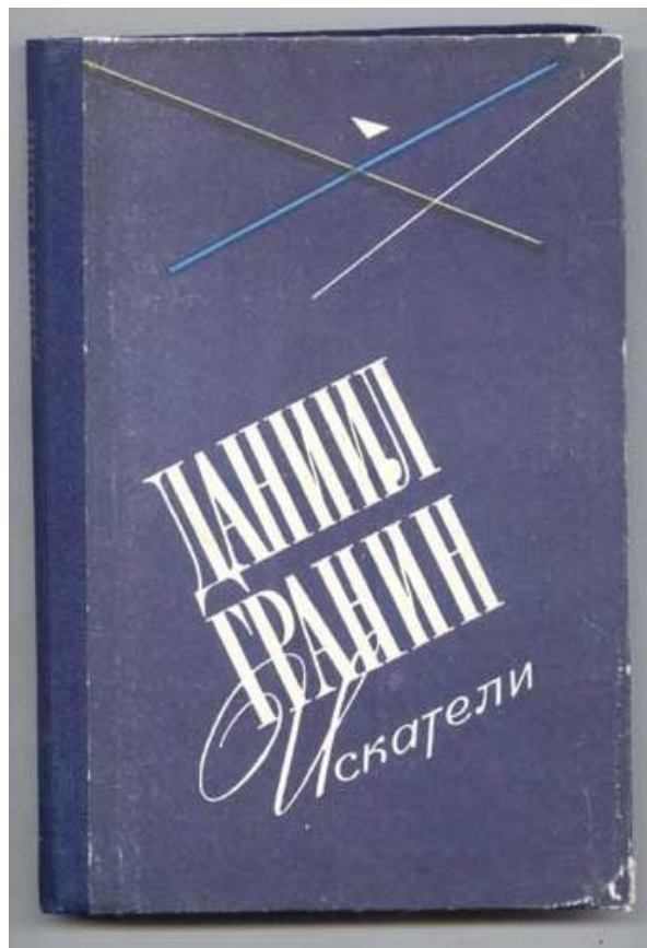
1954 г. - «Искатели» Д. Гранин