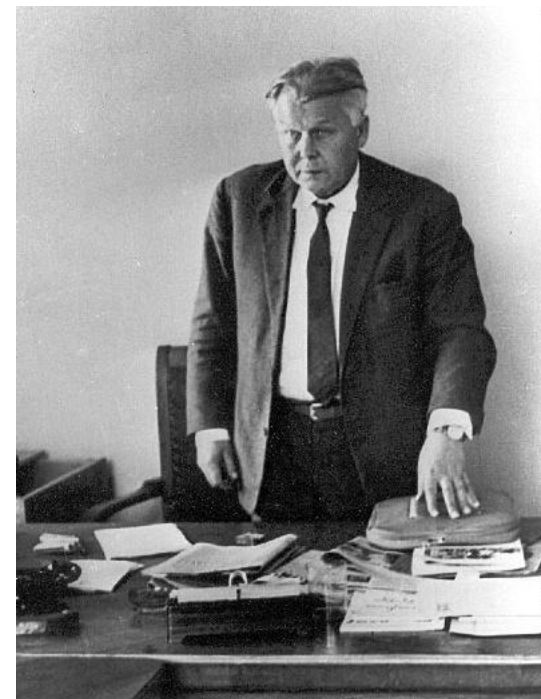
Александр Трифонович Твардовский

Власть признала публикацию этих работ «вредной» и отстранила А. Твардовского от руководства журналом