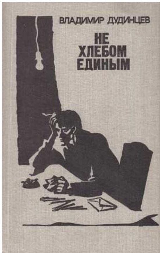
1956 г. – «Не хлебом единым» В. Дудинцев