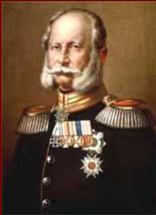
Император Германской империи (кайзер) Вильгельм I Гогенцоллерн (1871-1888)