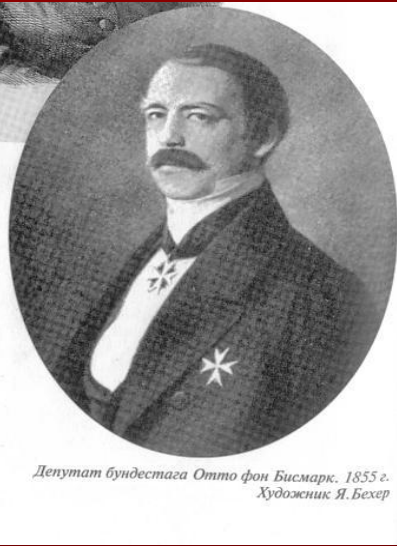
Депутат бундестага Отто фон Бисмарк. 1855 г. Художник Я. Бейер

1 апреля 1815 г. в поместье Шенхаузен в Бранденбурге в семье, объединившей по линии отца старинный род прусских дворян Бисмарков и род государственных служащих и ученых со стороны матери, родился сын Отто.