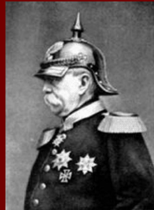
Канцлер Германской империи Отто фон Бисмарк (1871-1890)