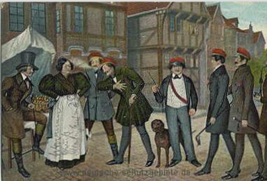
Bismarck als Student in Göttingen

1822: Eintritt in das Plamannsches Institut in Berlin. Am 10. Mai 1832 immatrikuliert Otto von Bismarck als Student der Rechte an der Universität Göttingen. Ab November 1833 setzt er sein Studium an der Universität in Berlin fort und absolviert am 20. Mai 1835 sein erstes juristisches Examen.