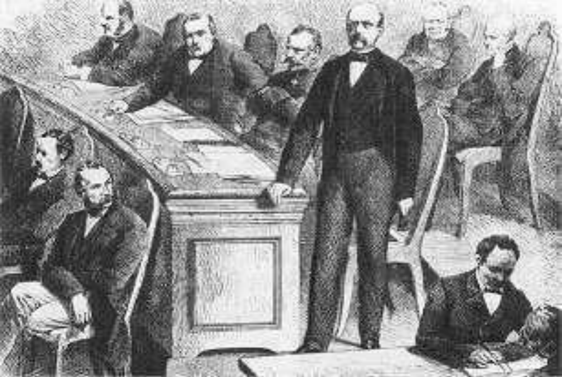
1867 : Gründung des Norddeutschen Bundes