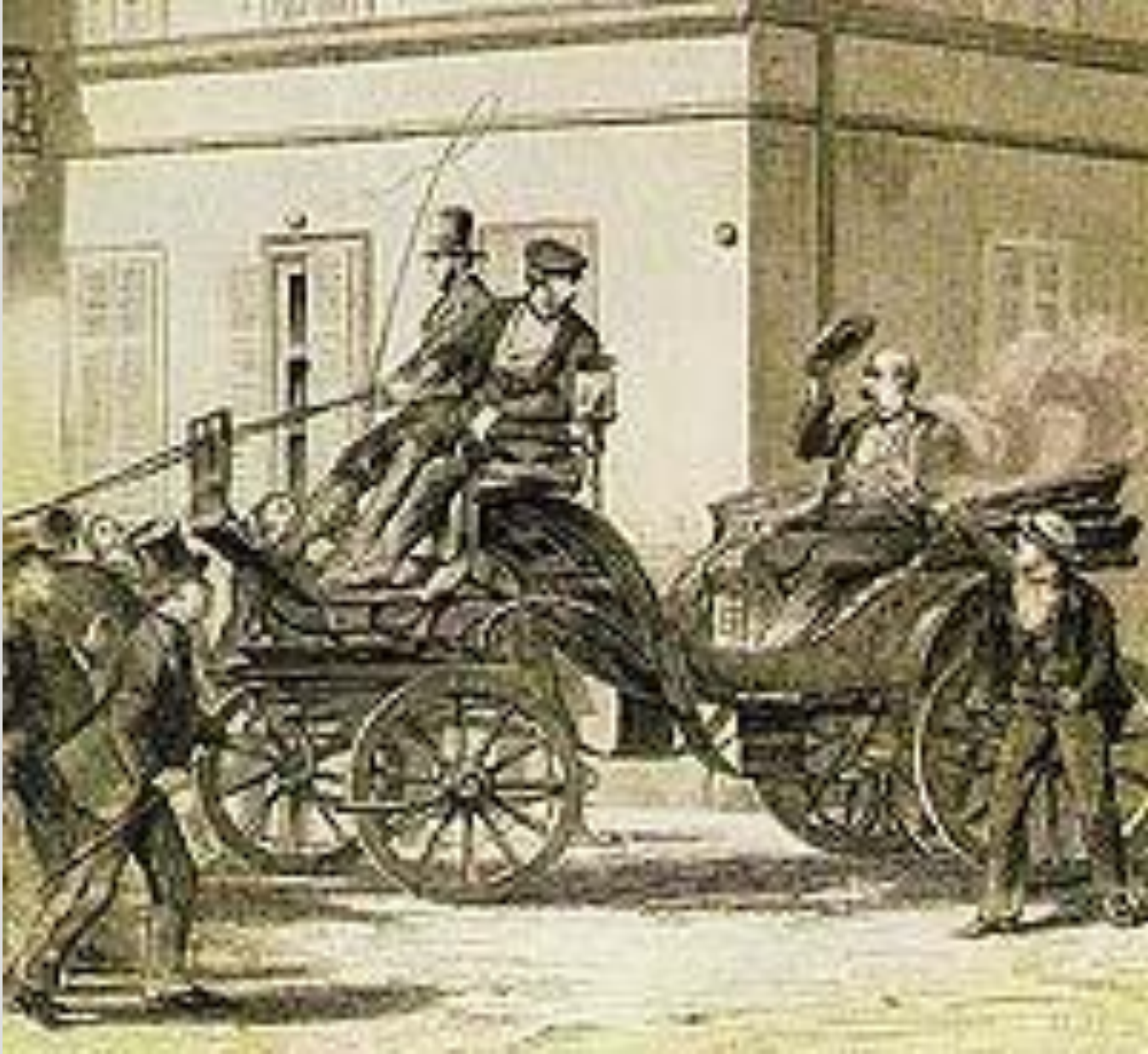
Das 2. Attentat auf Bismarck