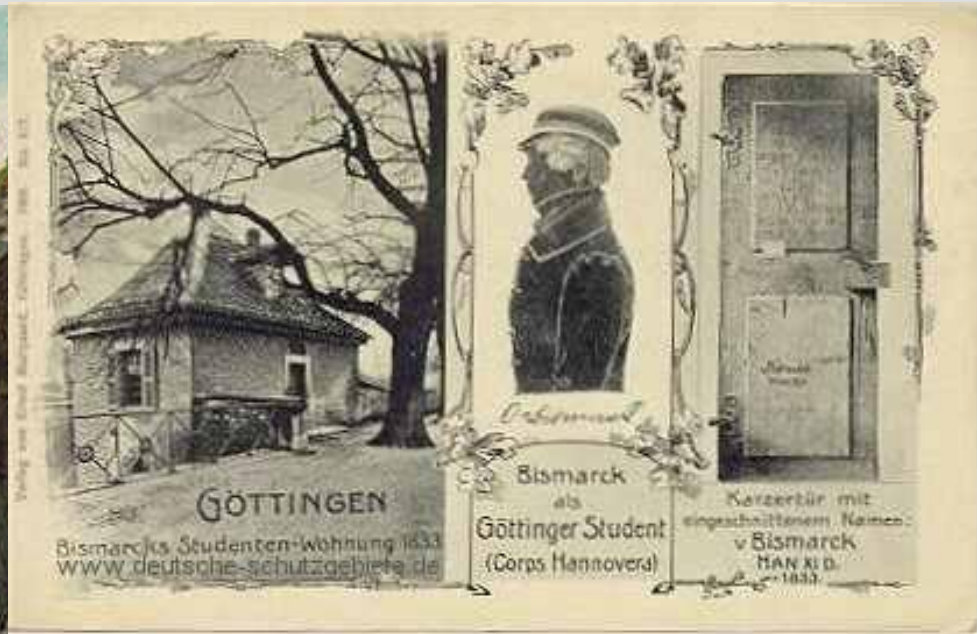
Bismarcks Studenten-Wohnung 1833