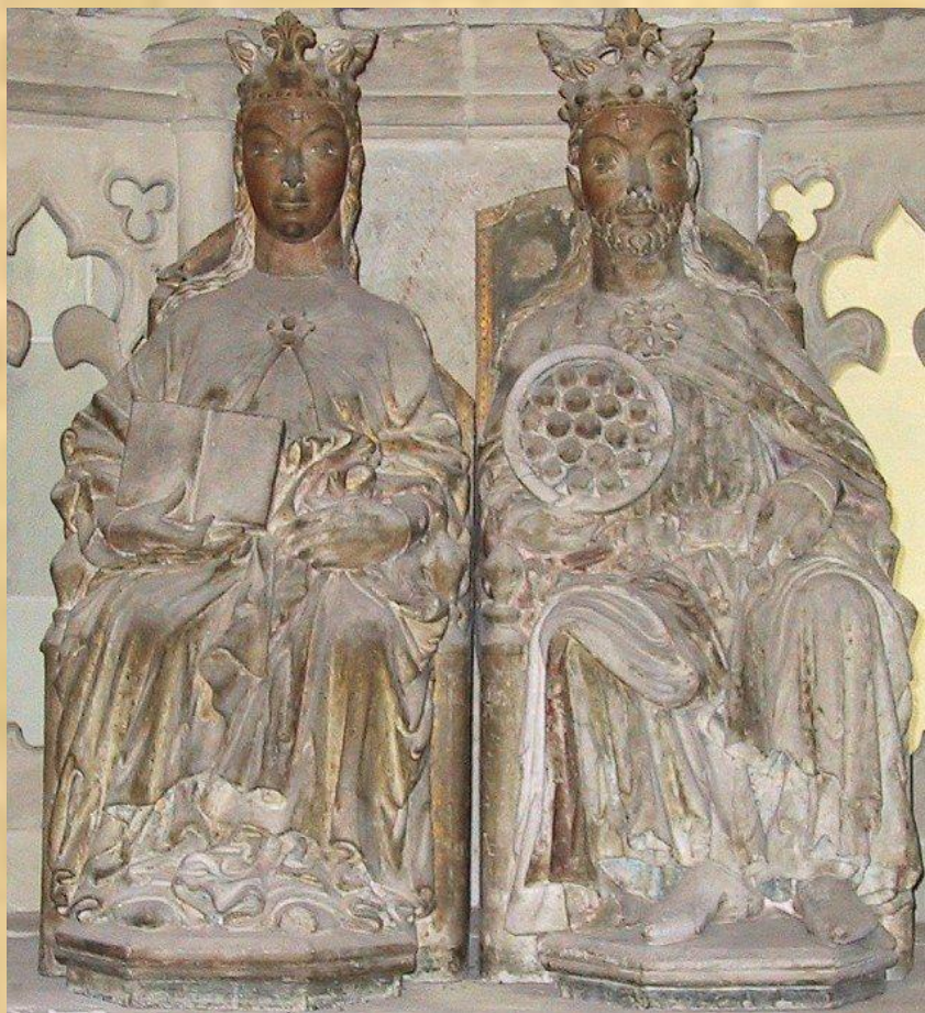
Статуя у соборі Магдебурга

Підставою численних єпархій він прагнув зміцнити і поширити християнство в Німеччині. Зробивши свою імперію могутнішою з усіх християнських держав, він в 951 р покликаний на допомогу Адельгейдою, вдовою Лотаря (XVIII, 27), перейшов через Альпи, одружився (перша дружина його Едіта померла в 946 р.) на Адельгейді і прийняв титул короля Італії.