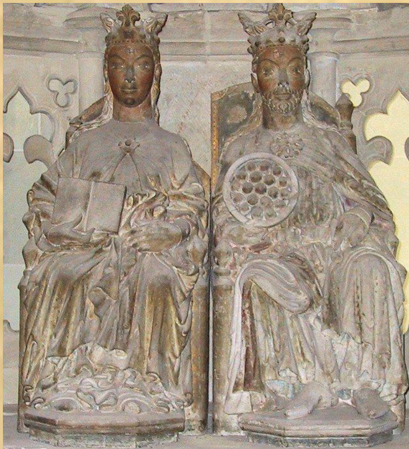
Статуя у соборі Магдебурга Оттон I і Едіт

Підставою численних єпархій він прагнув зміцнити і поширити християнство в Німеччині. Зробивши свою імперію могутнішою з усіх християнських держав, він в 951 р покликаний на допомогу Адельгейдою, вдовою Лотаря (XVIII, 27), перейшов через Альпи, одружився (перша дружина його Едіта померла в 946 р.) на Адельгейді і прийняв титул короля Італії.