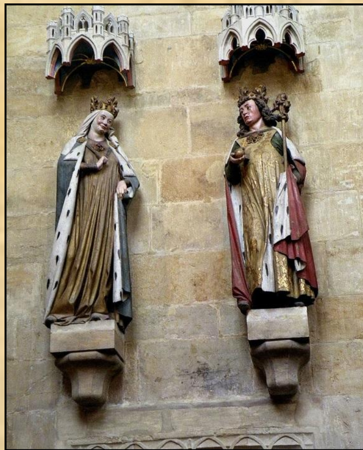
Оттон I і Адельгейда