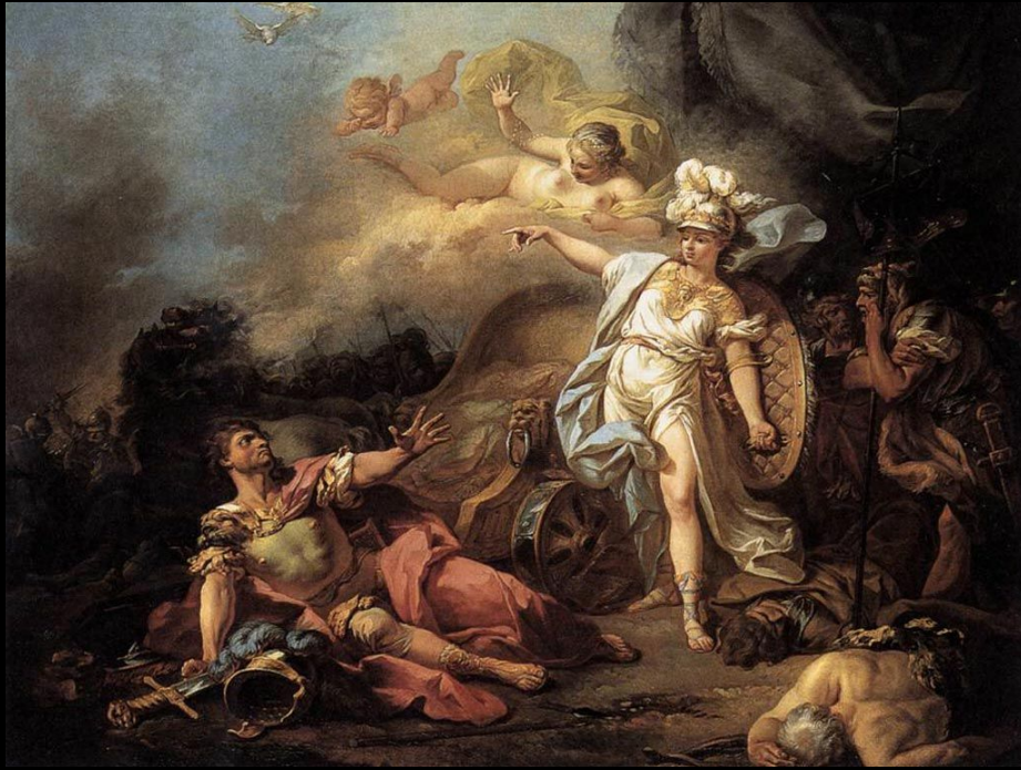
Битва Марса и Минервы Жак Луи Давид