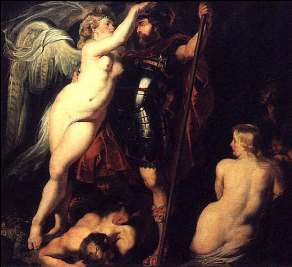
Марс и богиня Виктория Питер Пауль Рубенс

В римской мифологии, Марс первоначально входил в триаду богов, возглавлявших римский пантеон. По некоторым преданиям, он был наделен тремя жизнями, а потому воспринимался как вечное божество. Он сопровождает идущих на битву воинов, вселяя в них силу и мужество. Символ Марса - копье и двенадцать щитов, один из которых, по преданию, упал с неба. Римляне восприняли это как