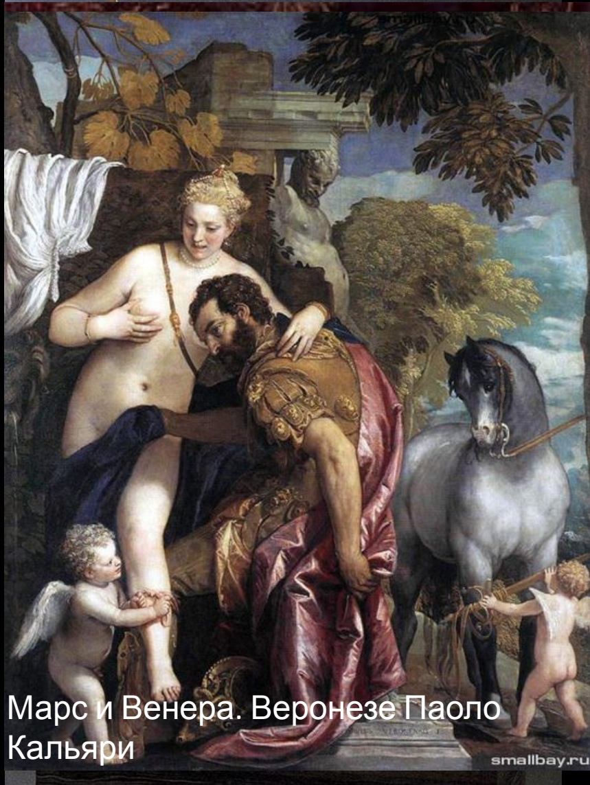
Марс и Венера. Веронезе Паоло Кальяри

Веронезе Паоло «Марс и Венера» Антонио Канова, 1816-22 гг.