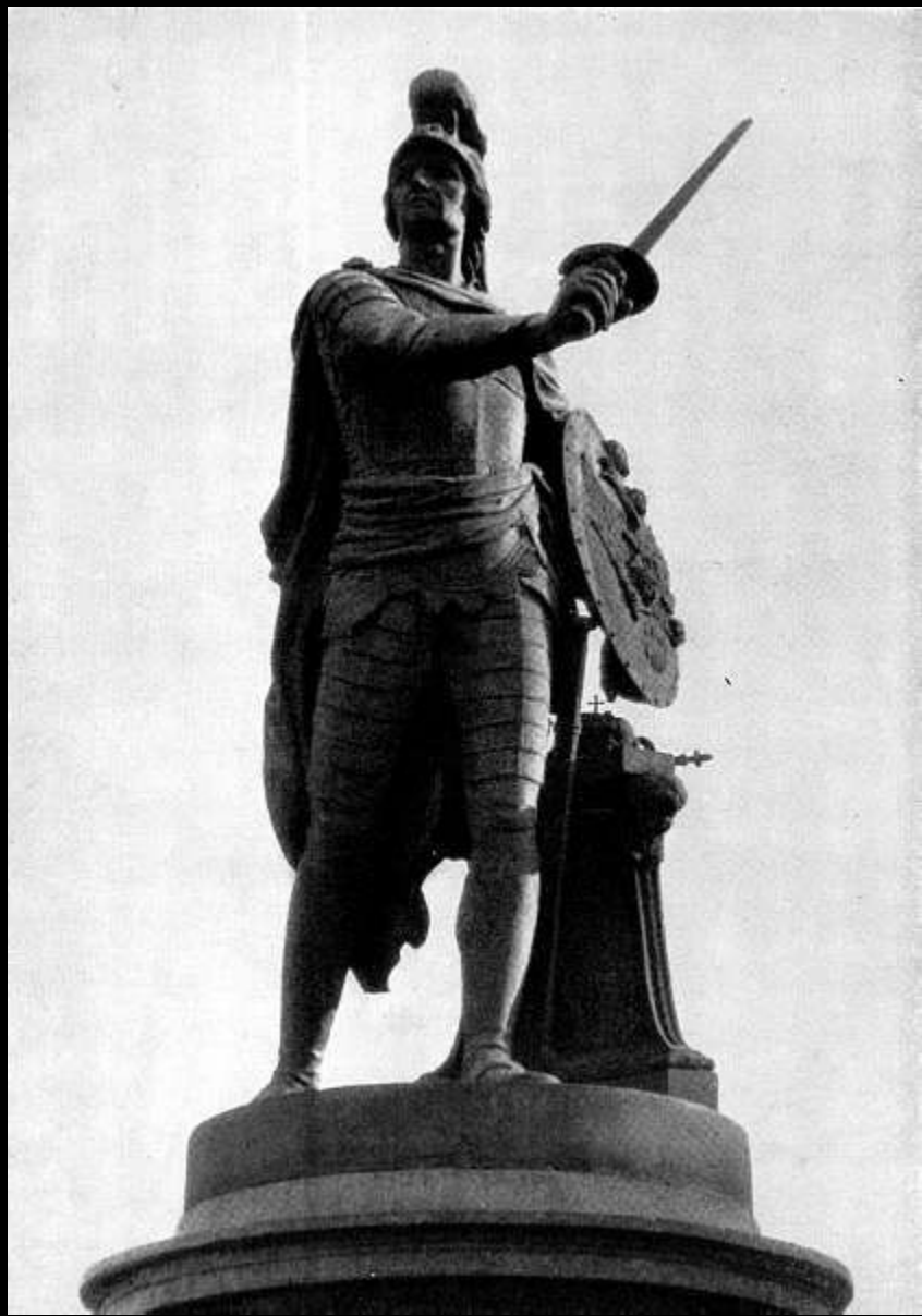
М. И. Козловский. Памятник А. В. Суворову в Ленинграде. Бронза. 1799-1801 гг.

Монумент А. В. Суворову был первым в Российском государстве памятником «некоронованной особе». Первоначально Козловский предполагал представить Суворова в образе Марса или Геркулеса. Однако в окончательном решении мы видим все же не бога или античного героя. Полная движения и энергии, стремительная и легкая фигура воина в латах устремлена вперед с той неукротимой быстротой и бесстрашием, которыми отличались героические дела и подвиги русских армий, руководимых Суворовым.