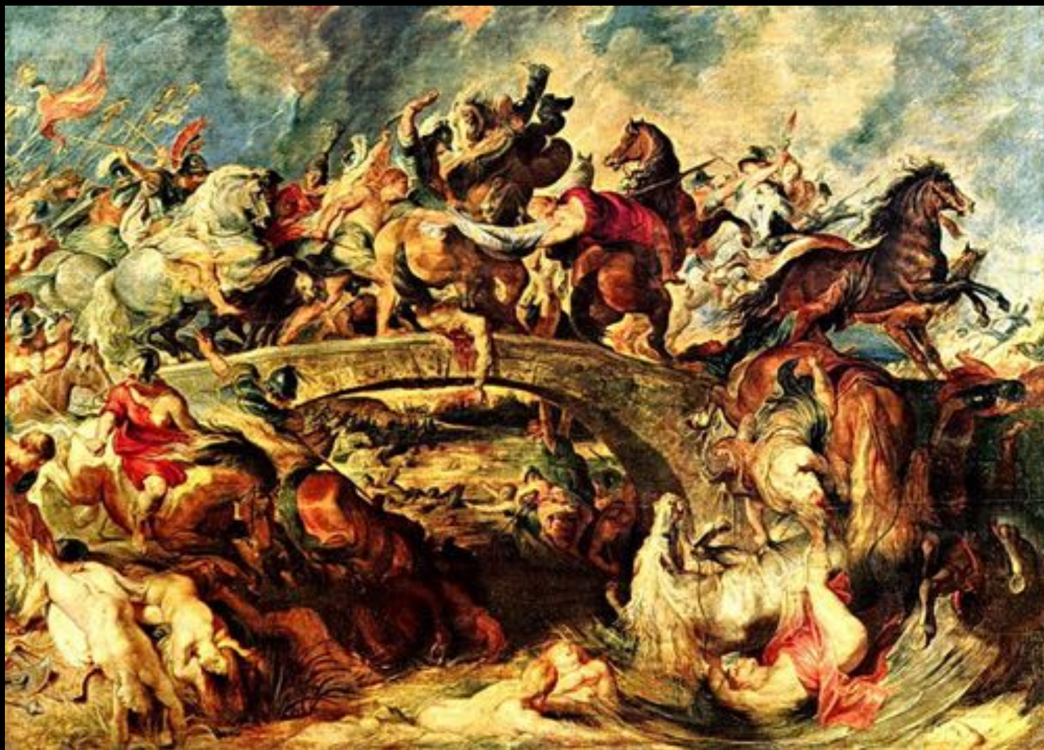
Битва с амазонками. Петер Пауль Рубенс

Амазонки - женщины-воительницы - отличались особенно воинственным характером. Они участвовали во многих кровавых битвах, испытывая при этом яростное упоение в бою.