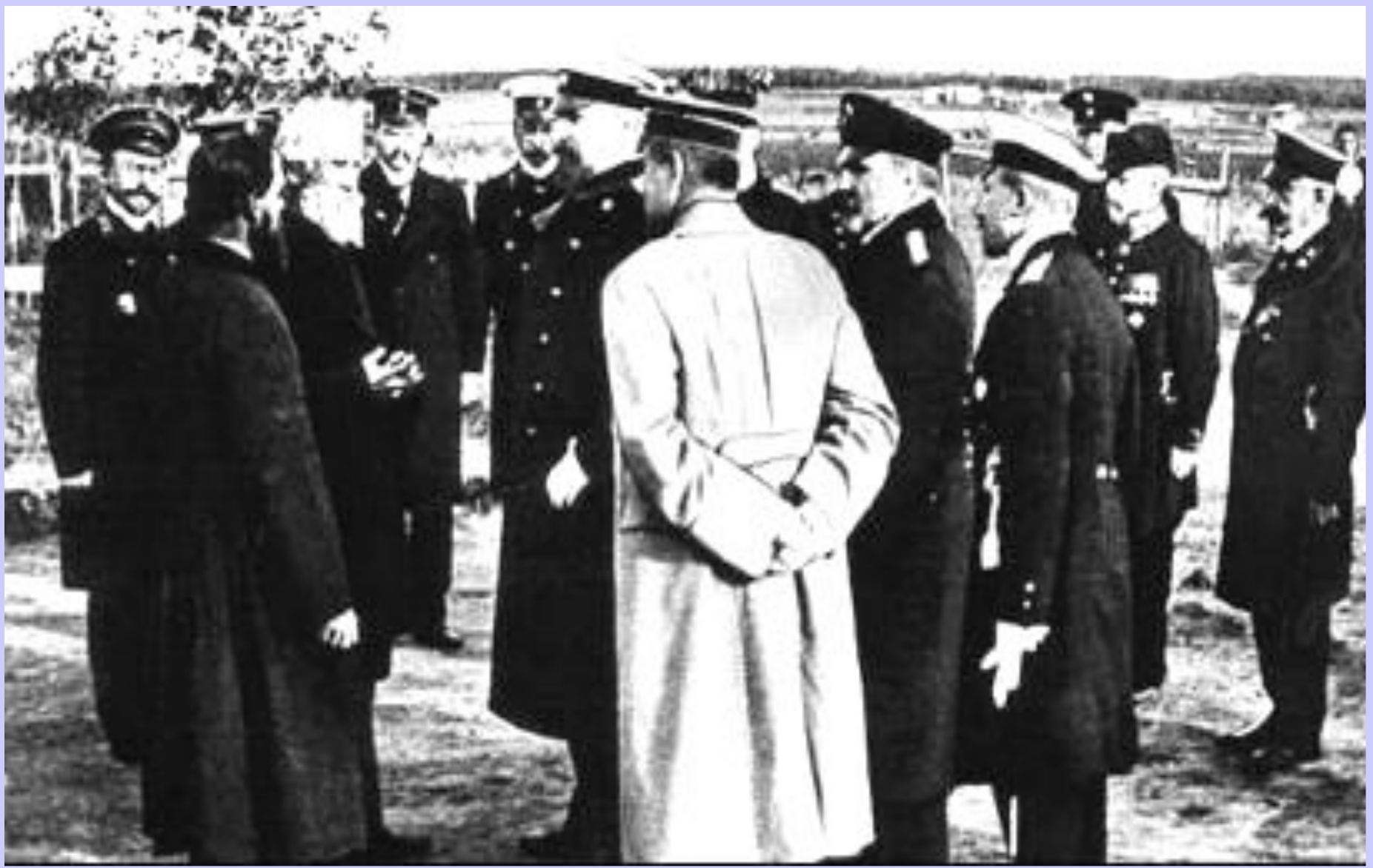
П. А. Столыпин в гостях у Иудея