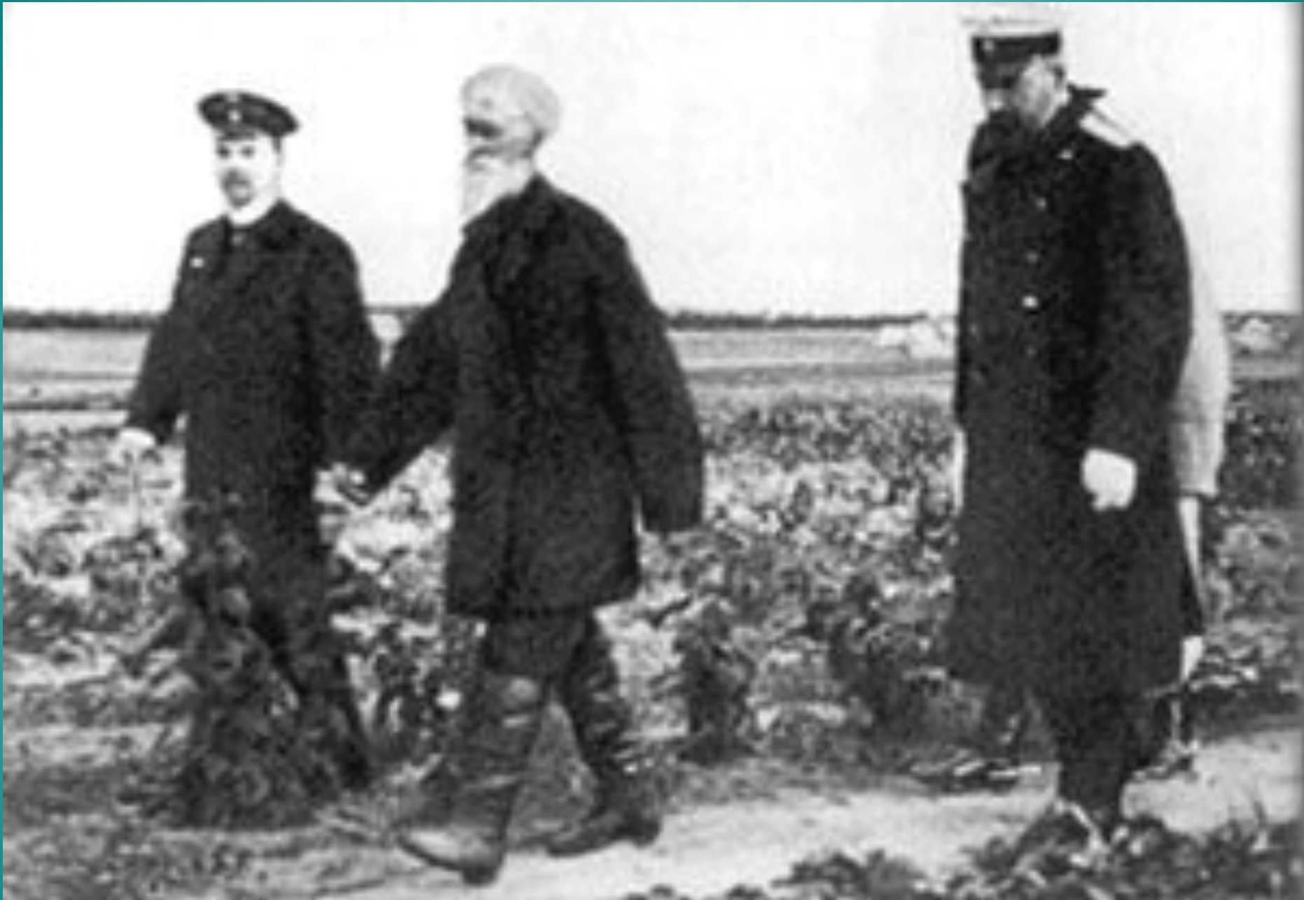
П.А.Столыпин осматривает хуторские огороды близ М