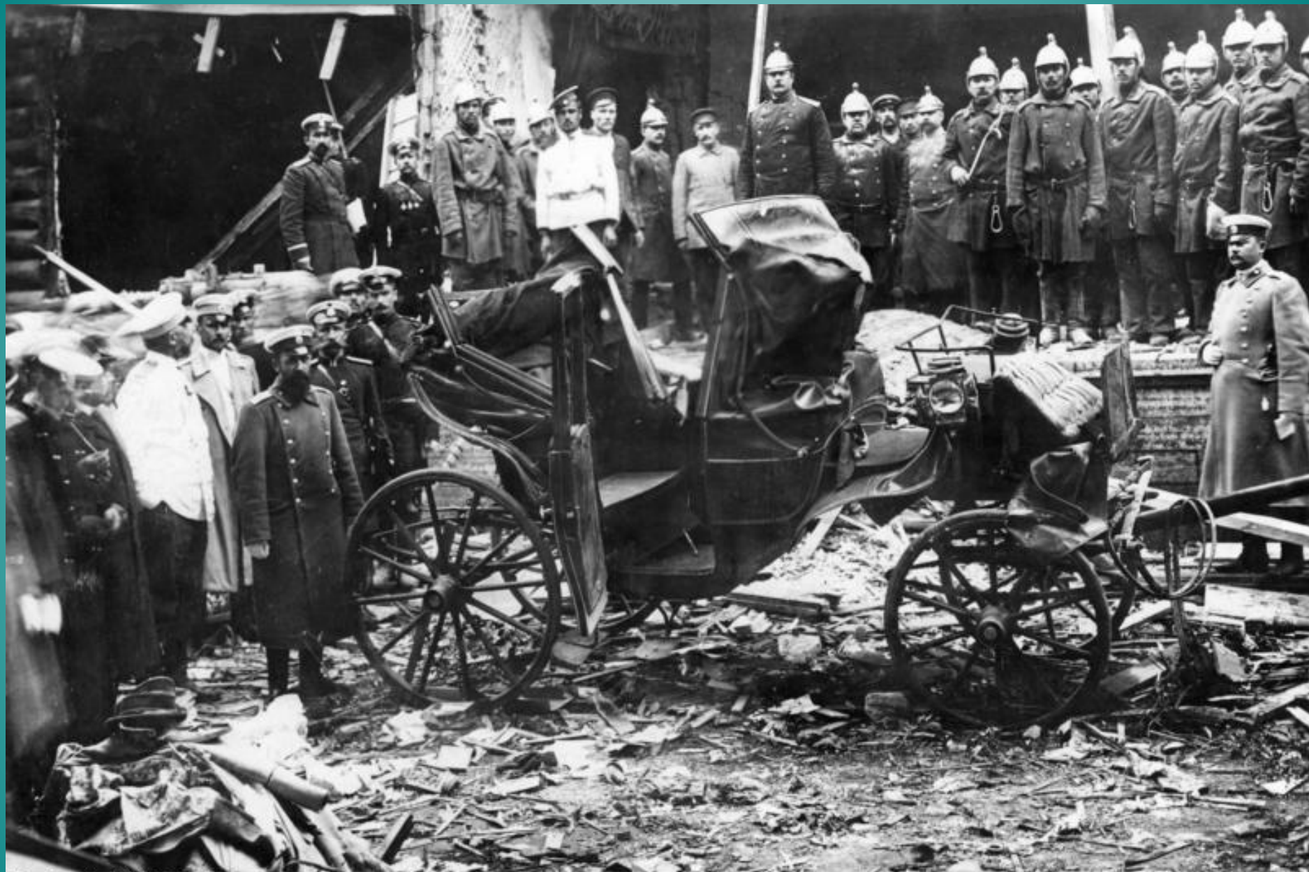
Bundesarchiv, Bild 183-R04510 Foto: o. Ang. | August 1906