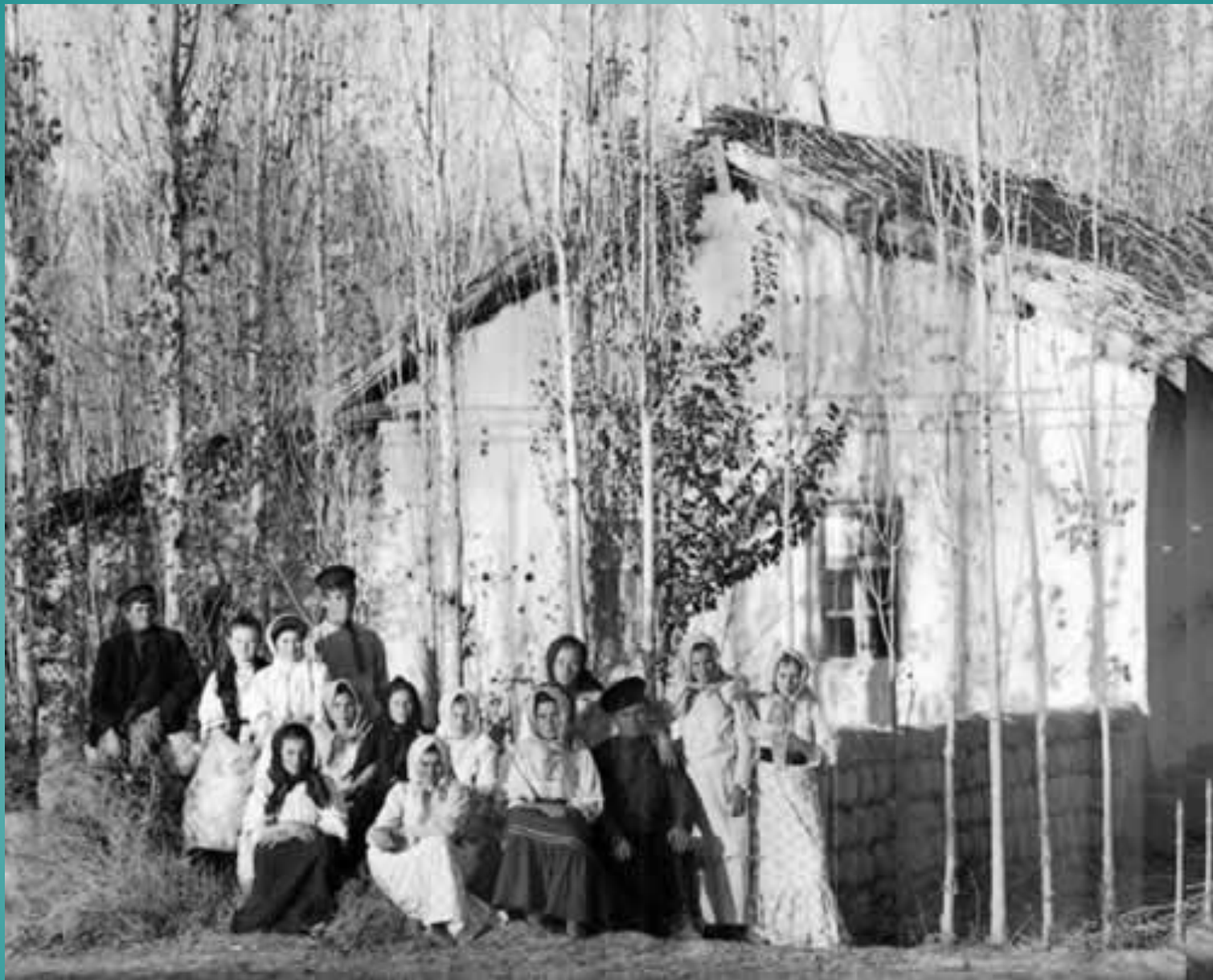
Русские переселенцы в Самаркандской губернии Туркестанского генерал губернаторства.