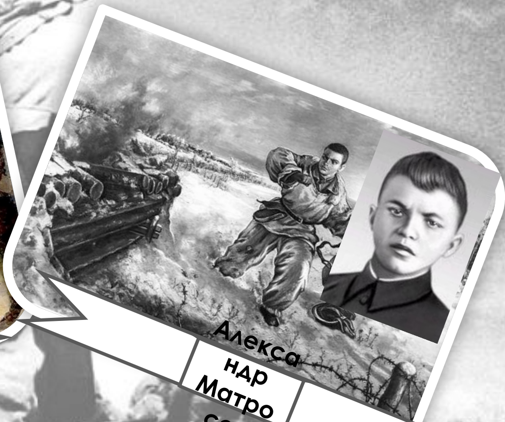
Алекса ндр Матро сов