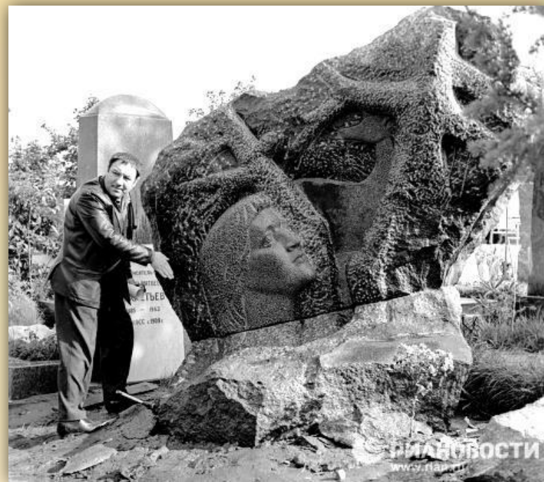
Надгробие писательнице Галине Николаевой

Скончалась Галина Евгеньевна Николаева 18 октября 1963 года в Москве, похоронена на Новодевичьем кладбище