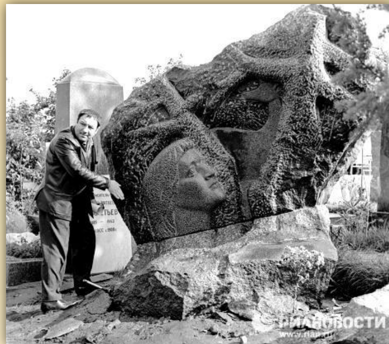
Надгробие писательнице Галине Николаевой

Скончалась Галина Евгеньевна Николаева 18 октября 1963 года в Москве, похоронена на Новодевичьем кладбище