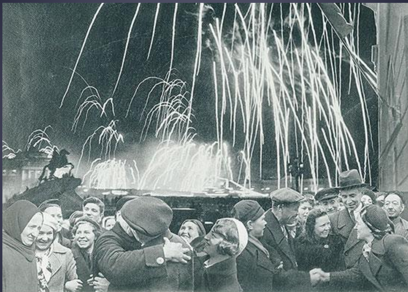
«Великая победа одержана советскими войсками под Ленинградом: